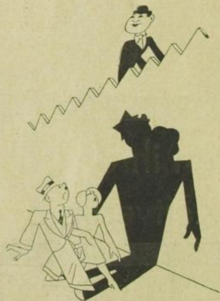
Was leicht ihm nun, zu seinem Glück, fällt: Kein Zaun versperrt ihm mehr das Blickfeld!