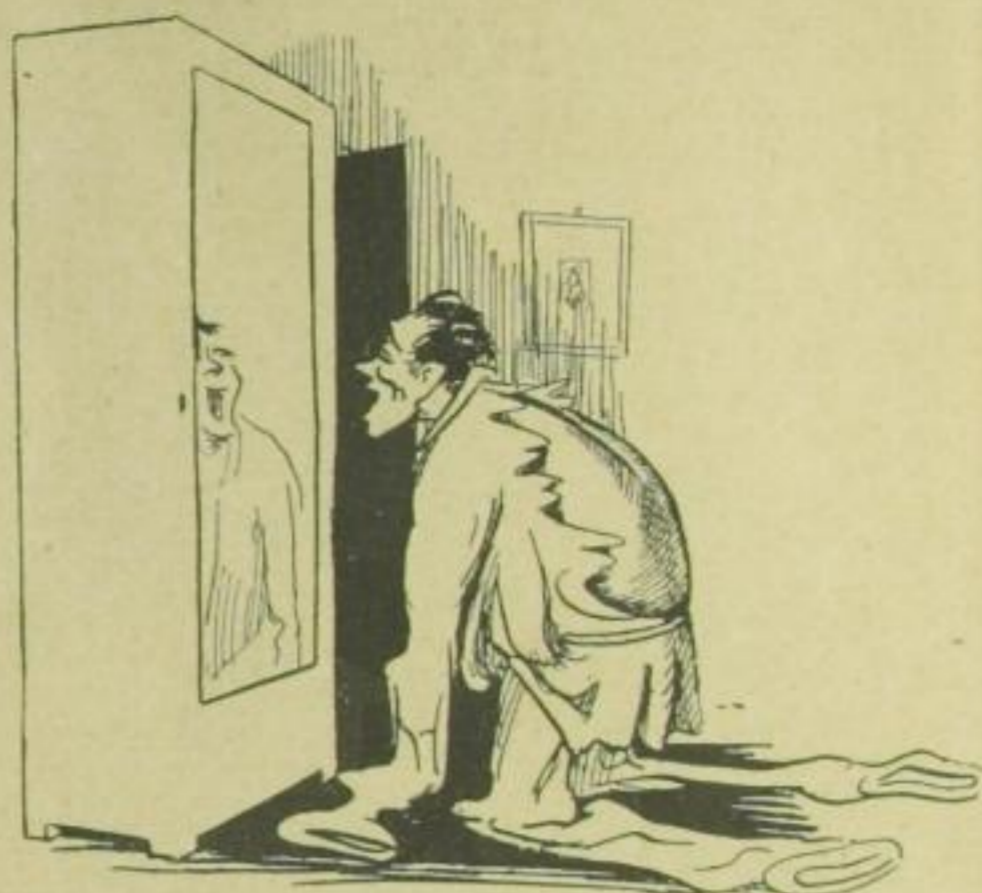
Zu lang sind Hos' und Aermel, ach! Der Rücken aber platzt mit Krach! . . .