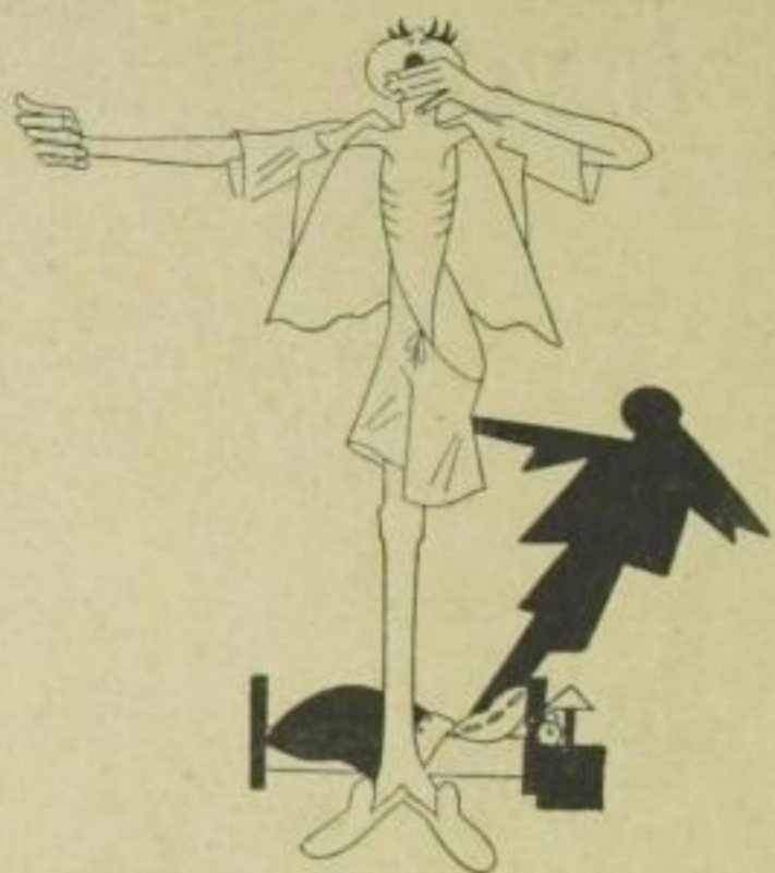
Sein eigener Anzug ist zu groß: Er braucht die halbe Hose bloß!