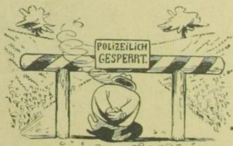
Er kann dem neuen Leib zudanke Aufrecht passieren jede Schranke!