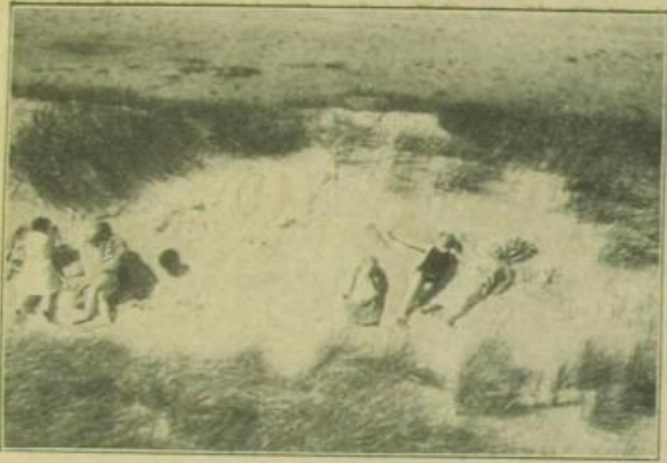
Dicht bei den Dünen des Ostseebades Neuhaus wird jetzt eine neue Sommersiedlung entstehen

neuen, wirtschaftlich sehr interessanten Weg beschritten, wie man jetzt zu einem Eigenheim an der Ostsee mit dem Aufwand der Unkosten nur eines Urlaubs kommt, indem sich mehrere befreundete Familien zusammenschließen und den Urlaub so einstellen, daß volle Ausnutzung des Hauses während der fünf Monate Mai bis September von 7 Parteien je drei Wochen ermöglicht wird. Im ersten Jahr ist die Summe aufzuwenden, welche üblich beim Urlaubsaufenthalt mit der Familie in einer Pension verbraucht würde. — Der Rest des Wertes des eingerichteten Hauses mit dem Grundstück wird mit Jahresraten von 90 bzw. 40 RM ohne Belastung des Etats des Angestellten durch das Rabattsystem abbezahlt.