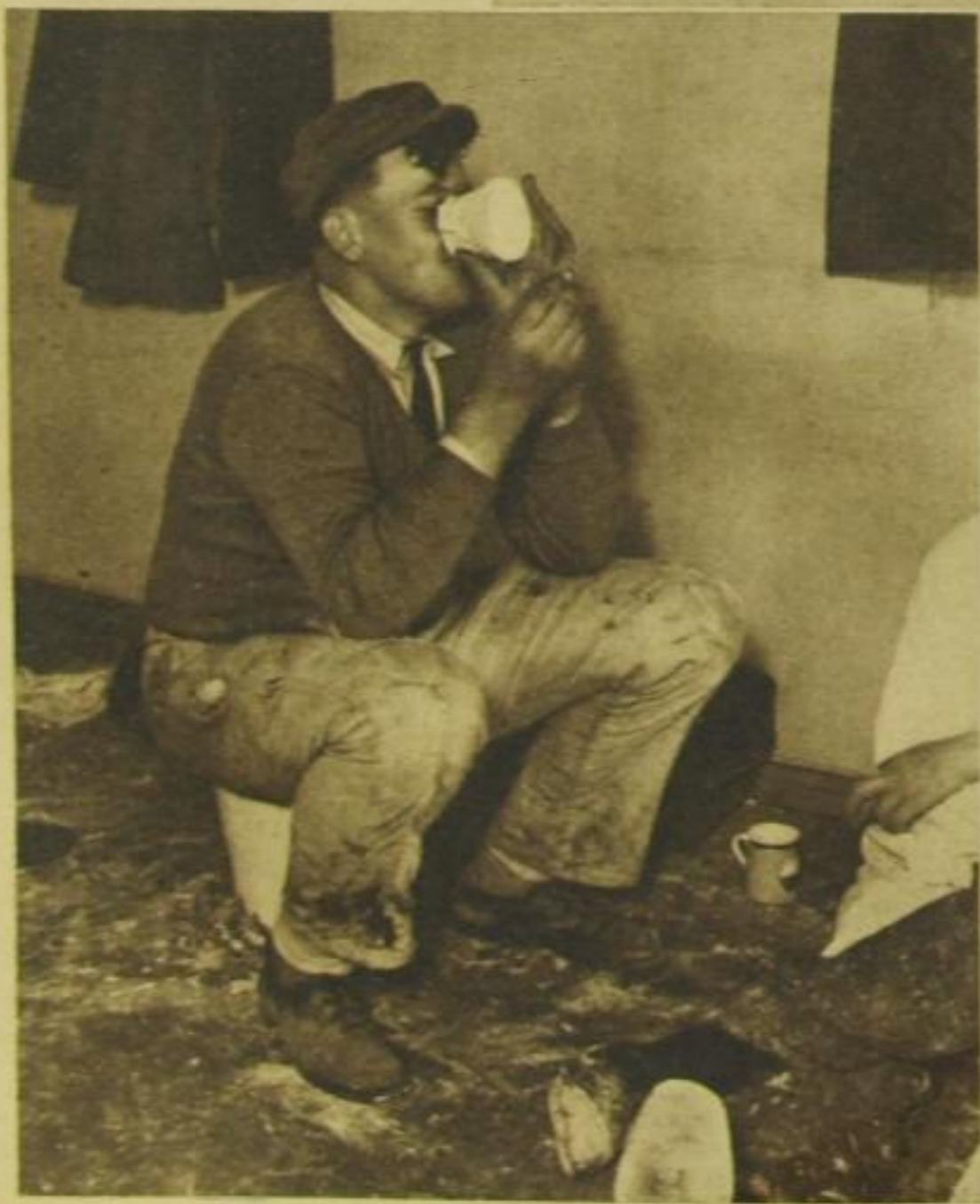
Frühstückspause – wie gelernt!

Selbst der schwierige Klaviertransport wird gemacht