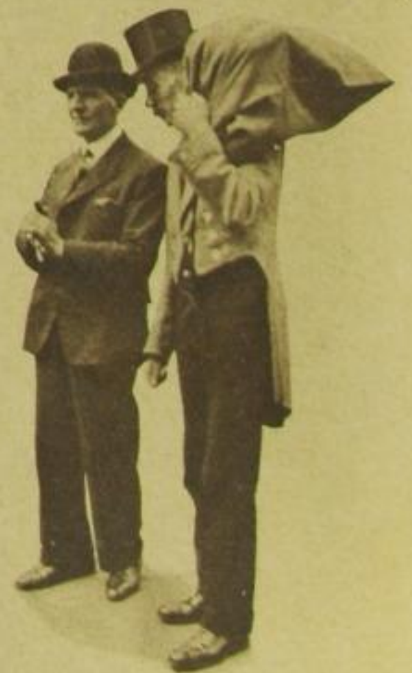
„Feierlicher“ Geldtrans- port: Bankdiener im Frack und Zylinder mit dem Geldbeutel auf dem Rücken