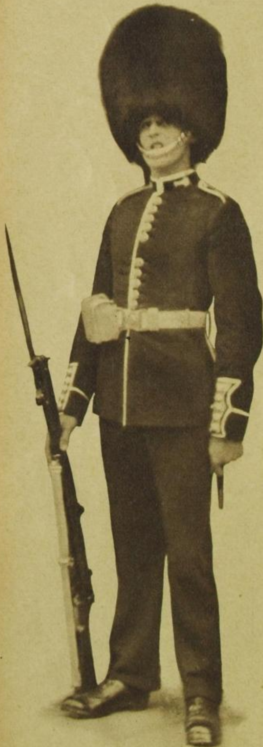
Schildwache vor dem Palais des Prinzen von Wales