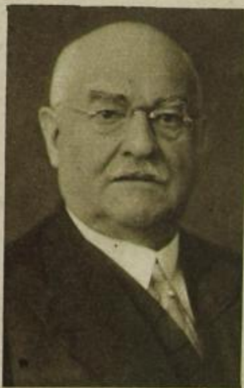
Dr. Carl Duisberg Geh. Reg.-Rat Prof. D. Dr. phil. Dr. Ing. e. h. Vorsitzender des Verwaltungsrats und Aufsichtsrats der I. G. Farbenindustrie Aktiengesellschaft, Mitglied des Reichswirtschaftsrats, Ehrenvorsitzender und Ehrenmitglied des Reichsverbandes der Deutschen Industrie

I ch bin aus ganz bescheidenen bürgerlichen Verhältnissen hervorgegangen. Auf dem Sehlhof, in der Nähe von Wupperfeld im Wuppertal, betrieben meine Großeltern neben einem kleinen landwirtschaftlichen Betrieb die Seidenbandweberei. In einem einfachen Fachwerkhaus stand meine Wiege neben dem Bandstuhl, während meine Mutter dem Vater und seinem Gesellen die Spulen für die Getau (Bandstuhl) fertigmachte und das