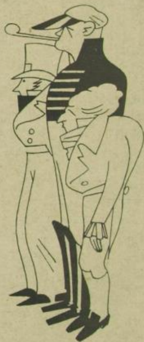
500 Kostüme wurden entworfen

Und es galt, 1000 Menschen — Personal, Chor, Ballett, Orchester, Sänger, Schauspieler, Ingenieure, Sattler, Schreiner, Tischler, Garderobieren, Pagen, Diener, Beleuchter — Brot und Arbeit mit dieser Aufführung auf Monate zu gewährleisten; es galt, aus hoher künstlerischer Inbrunst heraus, diesen 1000 Menschen, die mit dieser