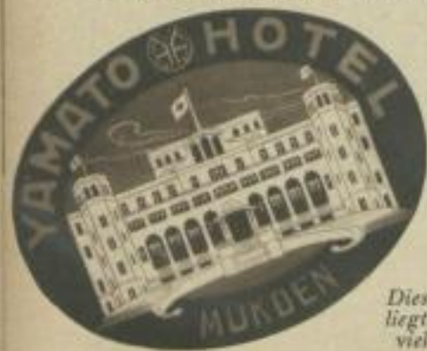
Dieses teuerste Hotel Ostasiens liegt im japanischen Zentrum der vielmühten Mandchurei

Und der Besuch im Weißen Haus bei Mr. Hoover erschien lediglich als Enttäuschung: ich hatte mir eingebildet, länger als 5 Minuten den Präsidenten der Vereinigten Staaten sprechen zu dürfen. Bei meiner ersten Begegnung mit der meistverdienenden Frau der Welt, dem Filmstar Constance Bennett in Hollywood, lief mir kein Schauer bewundernder