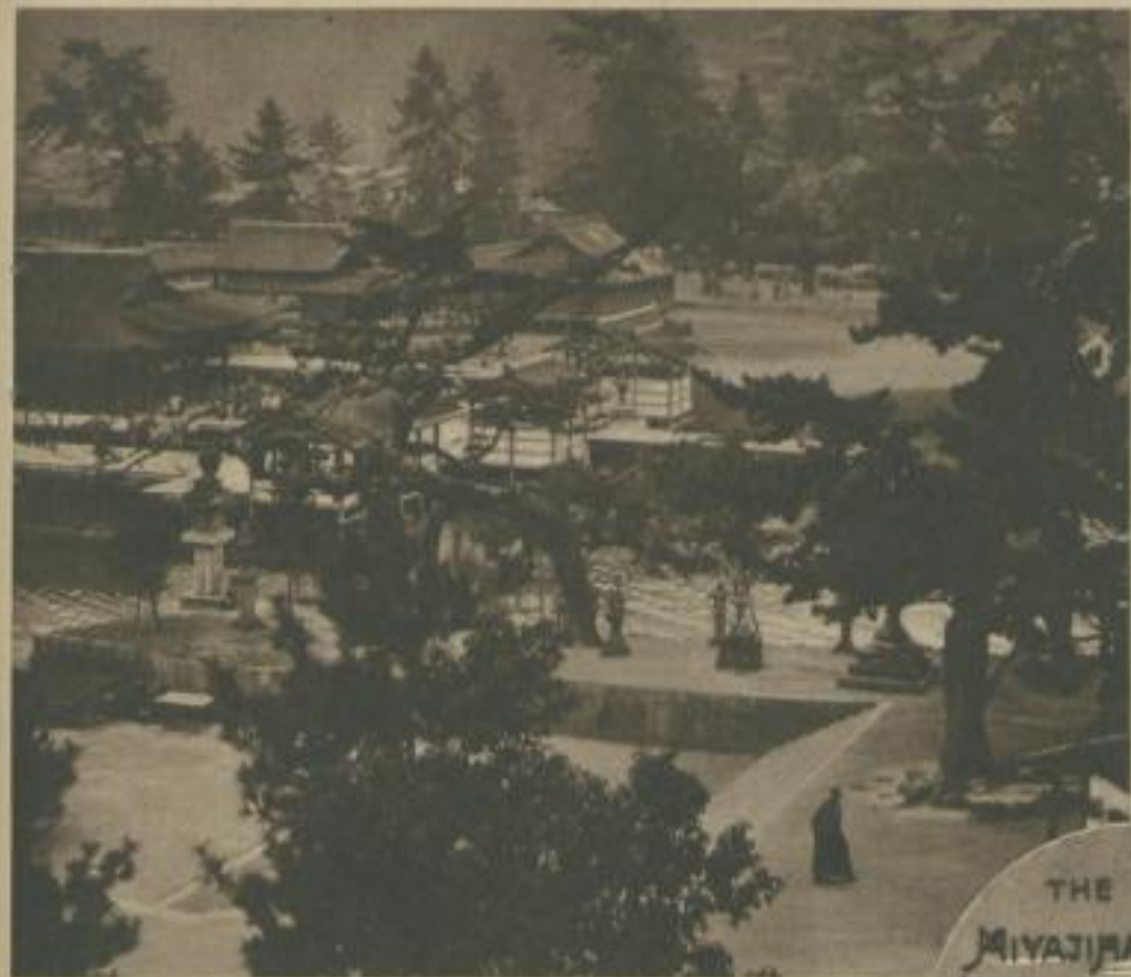
Das schönstgelegene Hotel, das ich auf meiner Weltreise kennen- lernte, war das Miyajima-Hotel in Japan. Diesen Blick hatte ich vom Hotelfenster aus