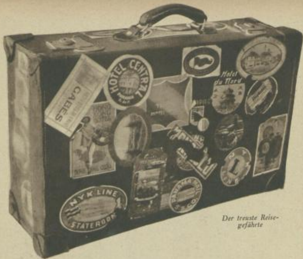
Der treuste Reise- gefährte