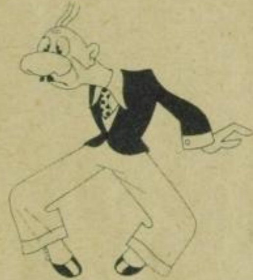
und über alles andere