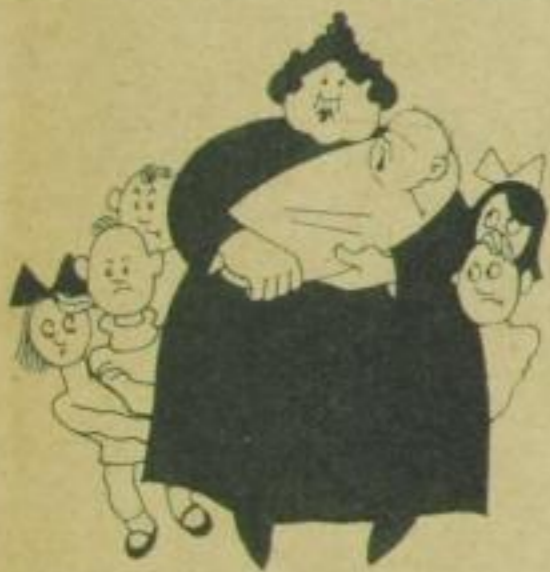
in der werten Familie