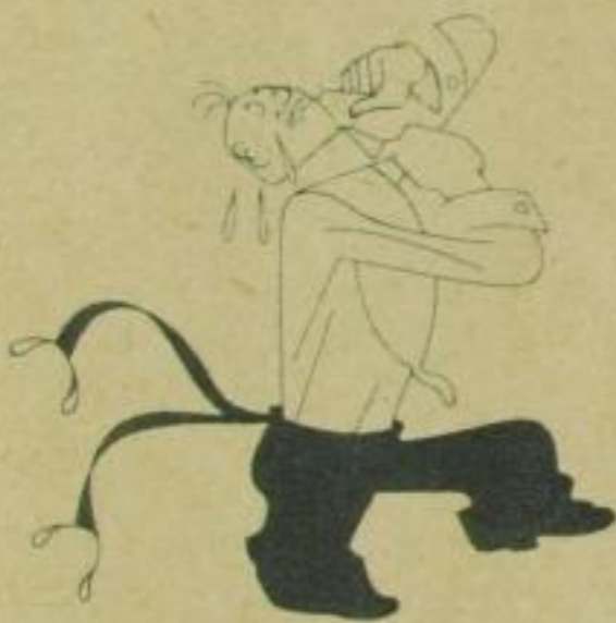
wenn der Kragenknopf nicht will