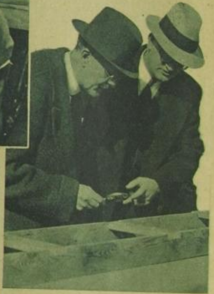
Wie in einem alten Kriminalfilm! Ein „Sherlock-Holmes“ untersucht mit der Lupe die Leiter, die von den Verbrechern bei der Entführung benutzt wurde