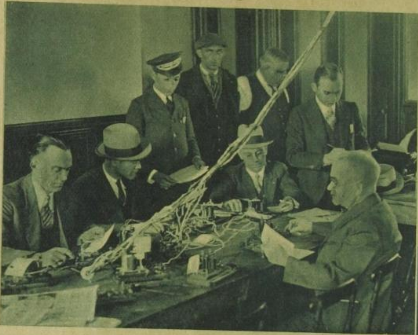
Hopewell, der sonst kleine, stille Ort, wurde zum Hauptquartier der Kriminalpolizei. In aller Eile wurde hier eine provisorische Funkstation eingerichtet. Dauernd gehen Instruktionen nach allen Teilen der Staaten, und ständig kommen Telegramme, die über den Stand der Nachforschungen berichten