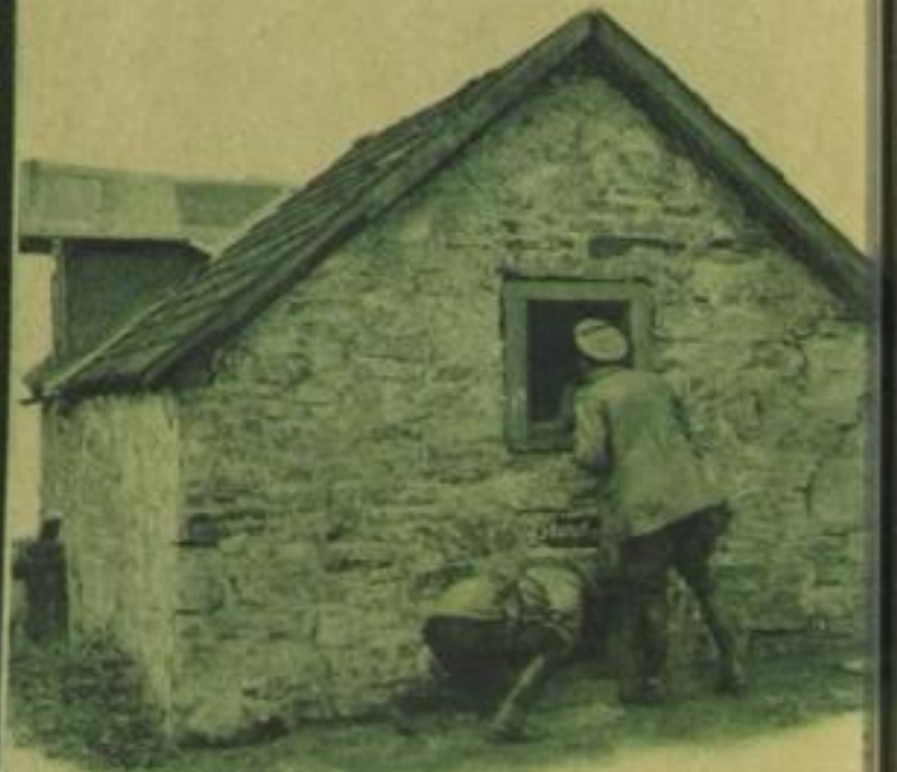
Sämtliche Scheunen und Baracken der ganzen Umgebung werden von Polizeitruppen durchforscht