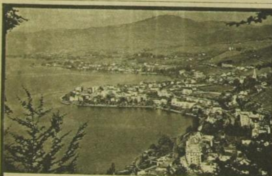
Montreux et le Mont Pélerin

b) von oben nach unten: 1 Sundainsel, 2 Gattin des Menelaus, 3 Salz der Borsäure, 4 türkischer Titel, 6 chinesischer Arbeiter, 7 Tageszeit, 10 Südfrucht, 11 Speise, 12 Spielzeug, 14 Fluß auf der Jütischen Halbinsel, 16 Erlaß, 18 klassisches Land, 19 englischer Astronom, 20 Stadt am Rhein, 22 Davids Vater, 24 männlicher und weiblicher Vorname. (15671)