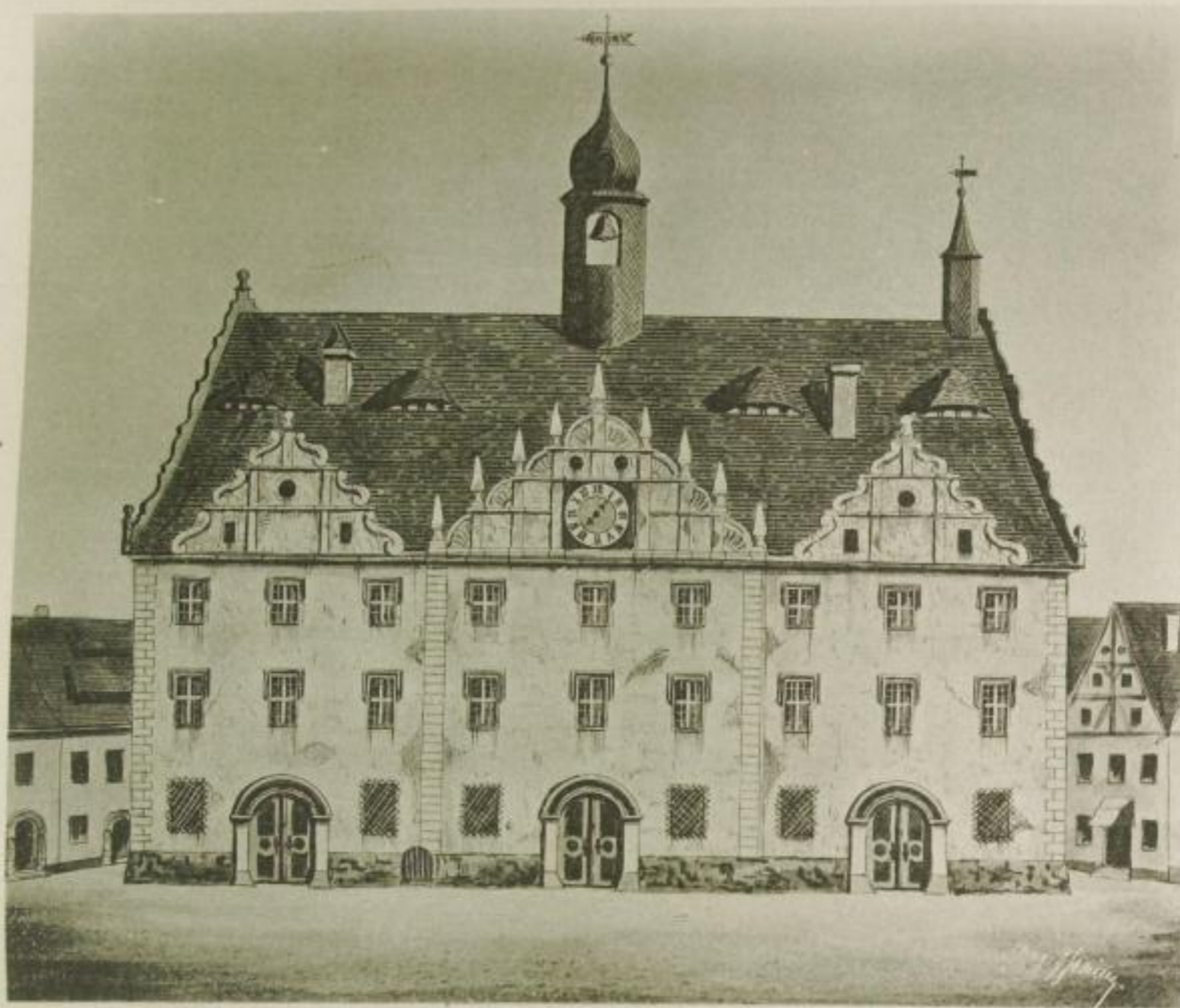
Das durch den Brand des Jahres 1744 zerstörte Rathhaus.