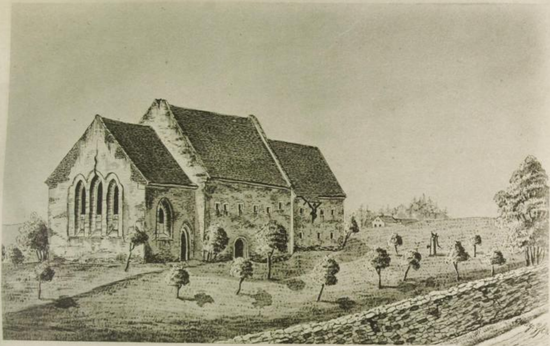
Das Jacobshospital um das Jahr 1830.