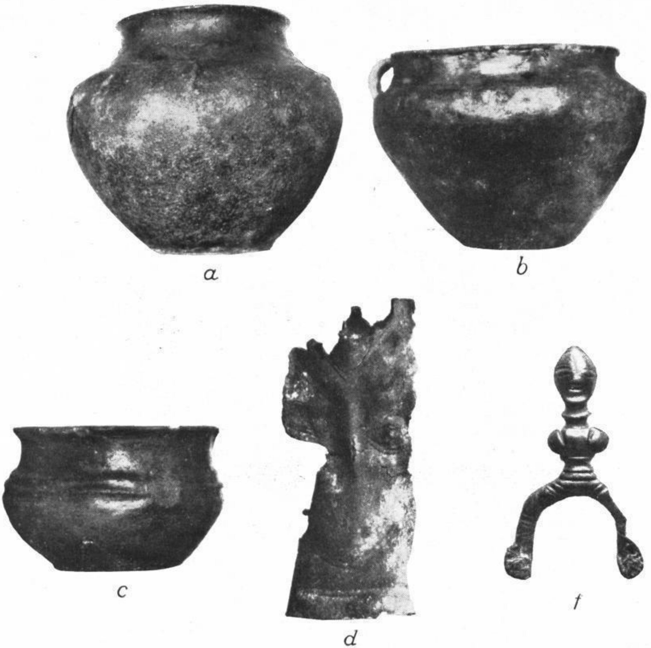
a: Urne 1, b: Urne 2, c: Urne 8, d: Bronzeblech mit menschlicher Maske, f: sporenförmiger Gürtelhaken mit Menschenfigur von Leipzig-Connewitz.