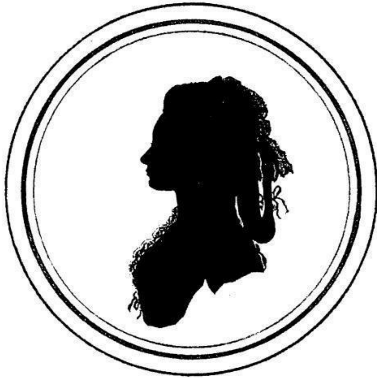
4002 Die Schauspielerin Sengbusch