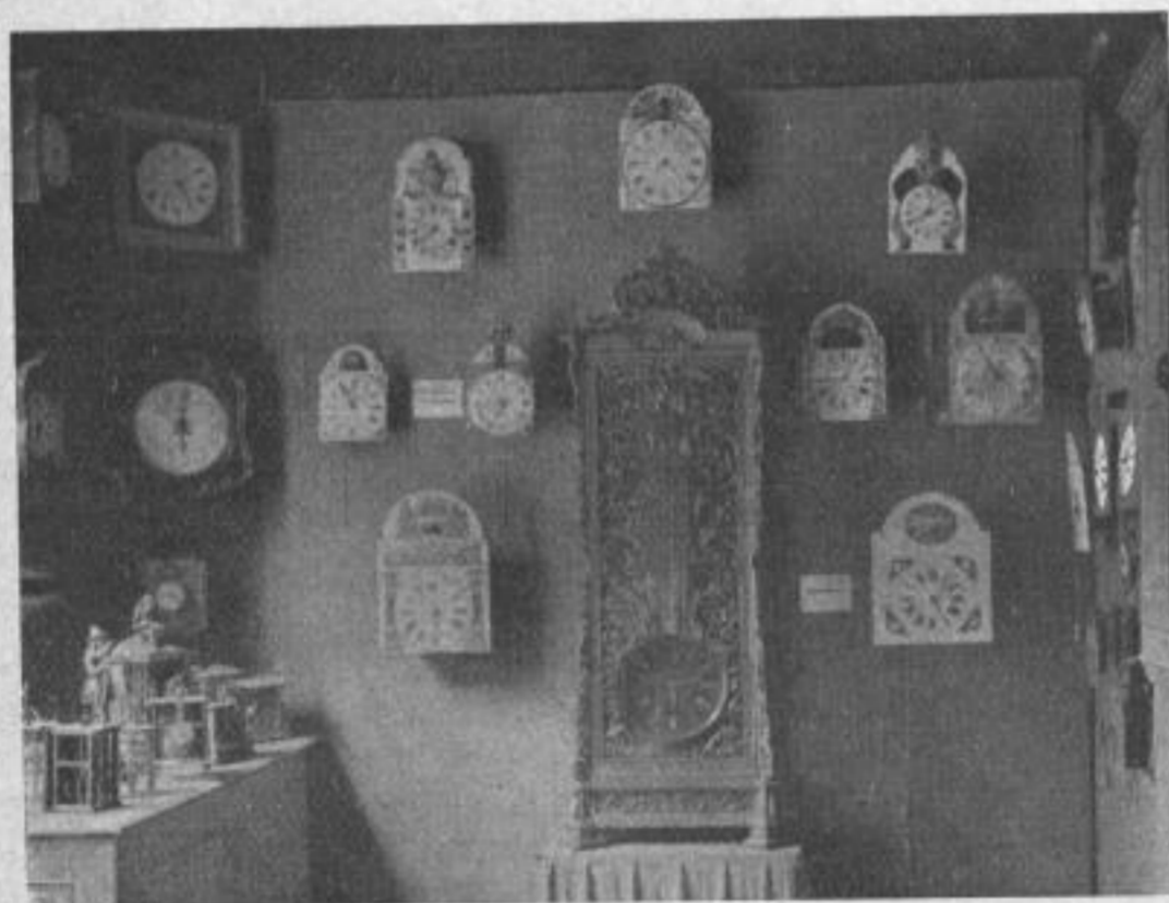
Schwarzwälder Männleuhren und Spieluhren

mülig der Auffassung, daß das Jubeljahr des Vereins nicht einem Festprunk, dem die Vergänglichkeit auf der Stirn geschrieben steht, gewidmet sein sollte, sondern daß man bleibende Werte schaffen und weiteren Generationen übermitteln wollte. Aus diesem Gedankengang heraus, der voll der großen und ernstesten Vergangenheit des Vereins würdig ist, eines Vereins, der, aus schwerer Zeit