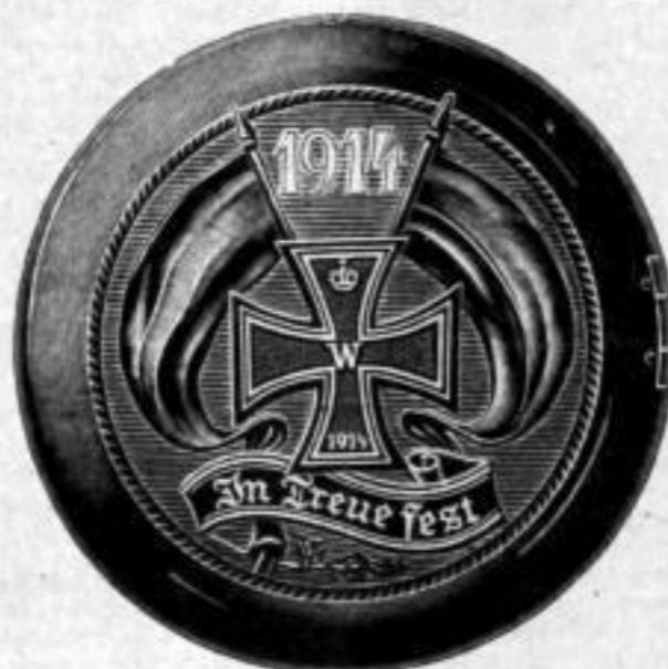
Nr. 9046. Mit Prägung. Gros Mk. AU,-. Dtz. Mk. A,au.