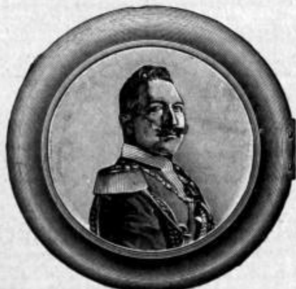
Nr. 9080. Kaiser-Kapsel. Gros Mk. AO,-. Dtz. Mk. A,ls. Die Kapseln sind mit wohlgelungener, in Nickel- rand gefasster Photographie versehen.