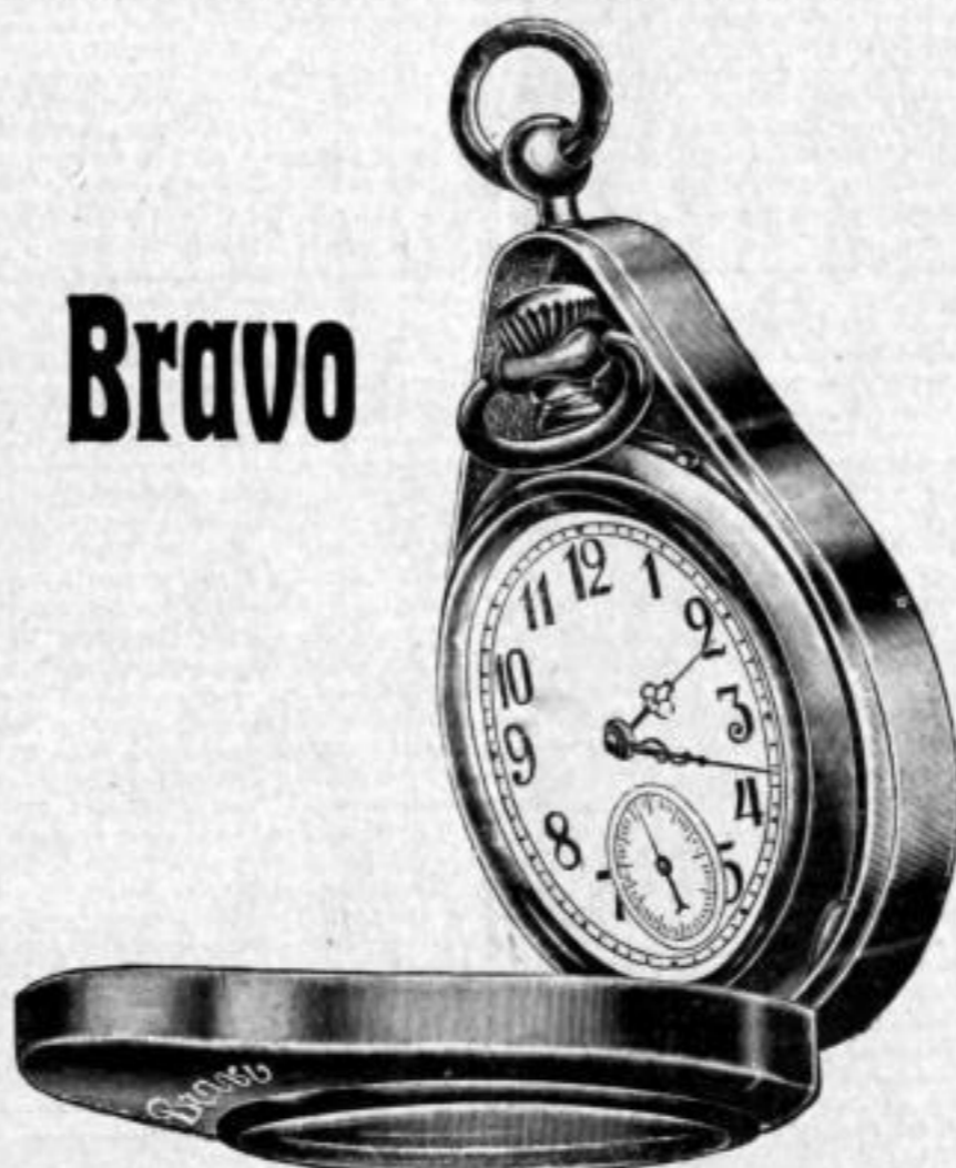
Nr. 8910. Mit Feder. Sehr beliebt. Gros Mk. US,-. Dtz. Mk. D.us.