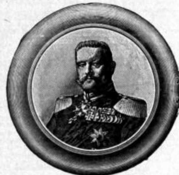
Nr. 9081. Hindenburg-Kapsel. Gros Mk. AO,-. Dtz. Mk. A,ls. Die Kapseln sind mit wohlgelungener, in Nickel- rand gefasster Photographie versehen.