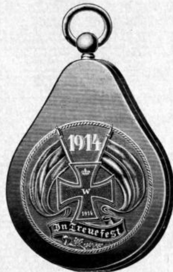
Nr. 9045. Mit Feder und Prägung. Gros Mk. UA,-. Dtz. Mk. D.lu.