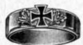
Nr. 5/2087. Superf. vergoldet. Dtzd. Mk. J,us.