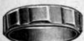
Nr. 5/2084. Superf. vergoldet. Dtzd. Mk. D,—.