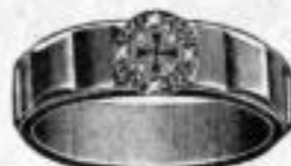
Nr. 5/2086. Superf. vergoldet. Dtzd. Mk. U,us.