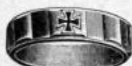
Nr. 5/2090. Kupferfarb. bronziert. Dtzd. Mk. U,us.