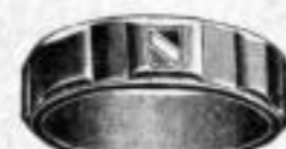
Nr. 5/2085. Superf. vergoldet. Dtzd. Mk. R,—.