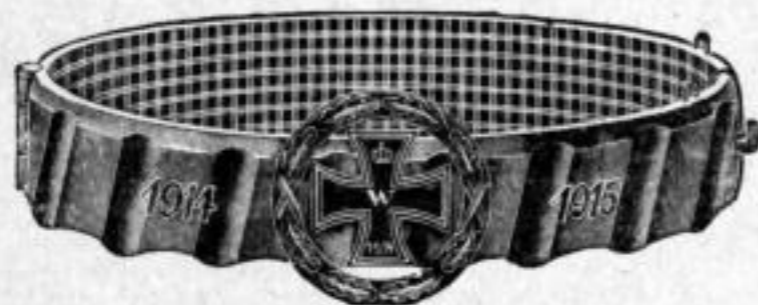
Nr. 50/0776. Stück Mk. U,ls.