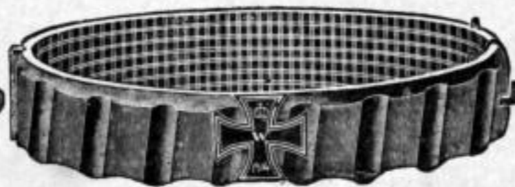
Nr. 50/0778. Stück Mk. L,au.