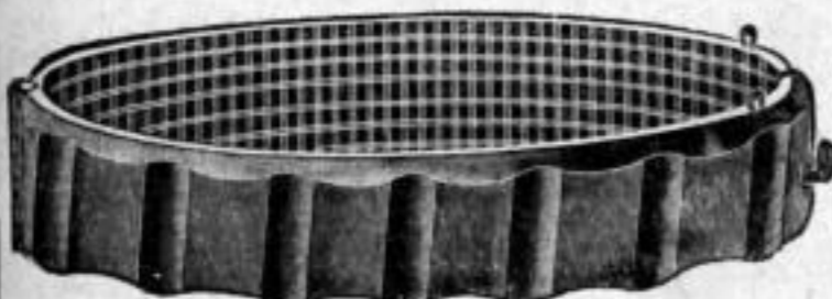
Nr. 50/0779. Stück Mk. A,uu.