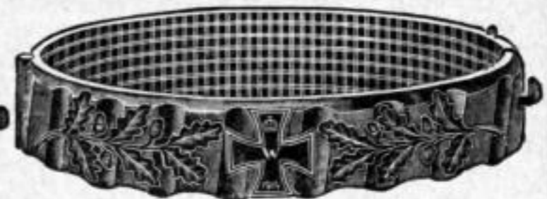
Nr. 50/0775. Stück Mk. D,rs.