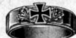
Nr. 5/2087. Superf. vergoldet. Dtzd. Mk. J,bu.