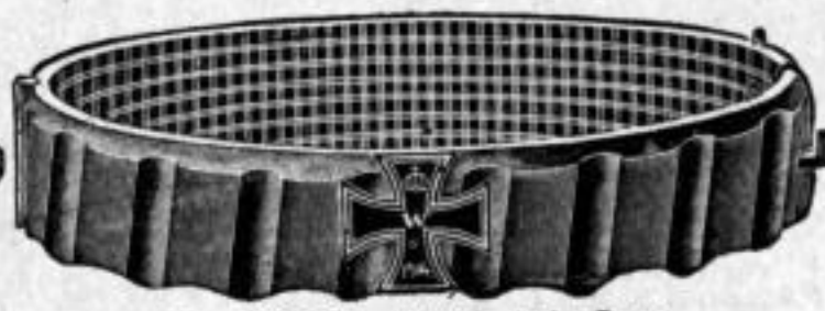
Nr. 50/0778. Stück Mk. L,us.