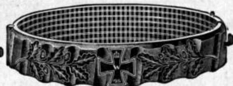
Nr. 50/0775. Stück Mk. D,nu.

Schachtel für Granatreifen Dtzd. Mk. B,os.