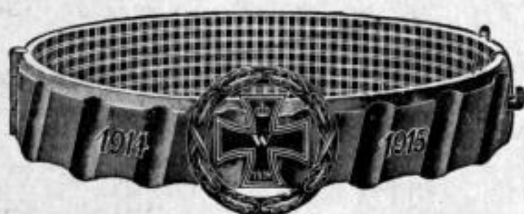
Nr. 50/0776. Stück Mk. U,ls.

Schachtel für Granatreifen Dtzd. Mk. B,os.