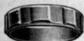
Nr. 5/2084. Superf. vergoldet. Dtzd. Mk. L,os.