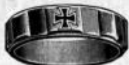
Nr. 5/2086. Superf. vergoldet. Dtzd. Mk. U,us.