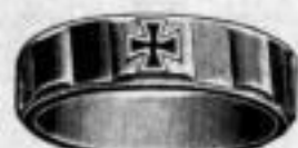
Nr. 5/2090. Kupferfarb. bronziert. Dtzd. Mk. U,us.