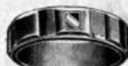
Nr. 5/2085. Superf. vergoldet. Dtzd. Mk. U,nu.