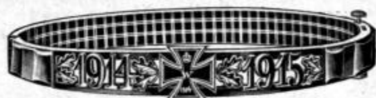
Nr. 534. Dtzd. Mk. DL,as