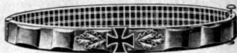
Nr. 536. Dtzd. Mk. LB,as