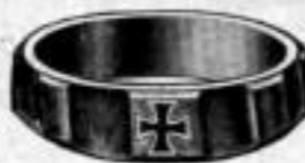
Nr. 93 Dtzd. Mk. U,su