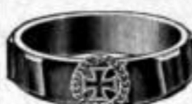
Nr. 95 Dtzd. Mk. U,su