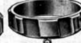
Nr. 91½, bronz. Dtzd. Mk. L,ns