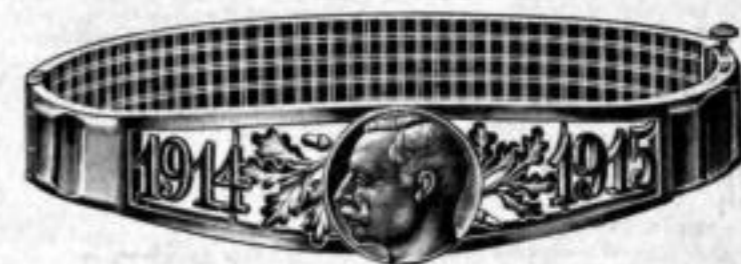
Nr. 529. Dtzd. Mk. DN,—