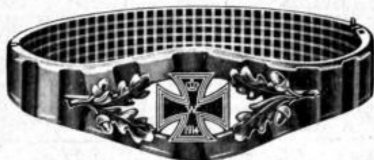
Nr. 550. Dtzd. Mk. DN,—