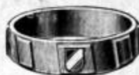
Nr. 92 Dtzd. Mk. U,ls