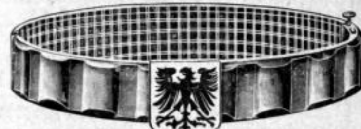
Nr. 532. Dtzd. Mk. LB,—