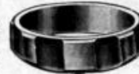
Nr. 98 Dtzd. Mk. U,ls