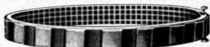
Nr. 546. Dtzd. Mk. AB,rs