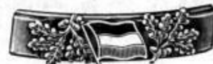
Nr. 721. Dtzd. Mk. BU,—