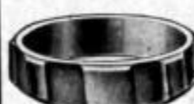
Nr. 97 Dtzd. Mk. U,ls