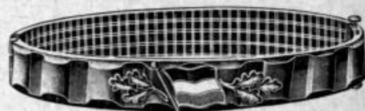
Nr. 535. Dtzd. Mk. LD,ns