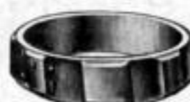
Nr. 91, matt Dtzd. Mk. L,ns