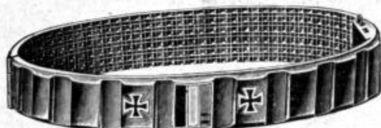
Nr. 523. Dtzd. Mk. LU,ds