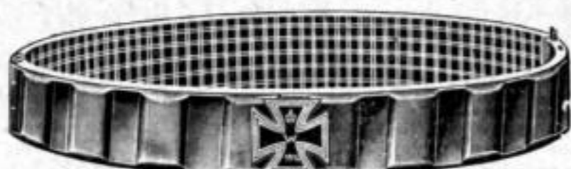
Nr. 525. Dtzd. Mk. LB,ns