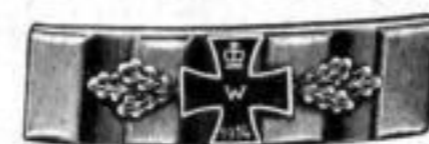
Nr. 722. Dtzd. Mk. BR,ns