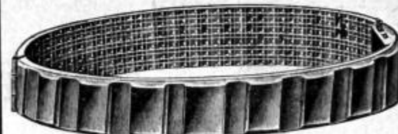
Nr. 521, poliert. Dtzd. Mk. AN,ns Nr. 522, matt. Dtzd. Mk. AN,ns Nr. 524, bronziert. Dtzd. Mk. AN,ns

Die Armbänder sind stark vergoldet und mit Scharnier und Schloss.