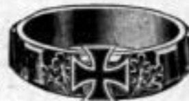
Nr. 94 Dtzd. Mk. R,ou