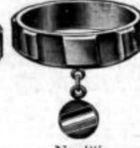
Nr. 91 1/2 , bronz. Dtzd. Mk. L,os