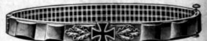
Nr. 536. Stück Mk. A,ns