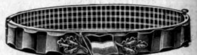
Nr. 535. Stück Mk. L,bu