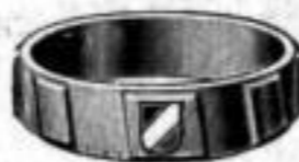
Nr. 92 Dtzd. Mk. U,nu