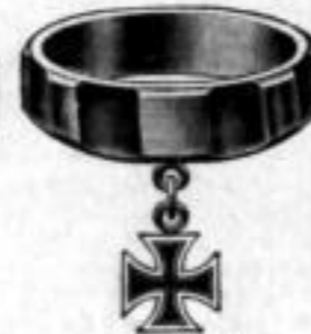
Nr. 98 Dtzd. Mk. U,nu