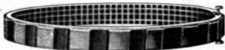
Nr. 546. Stück Mk. B,ou