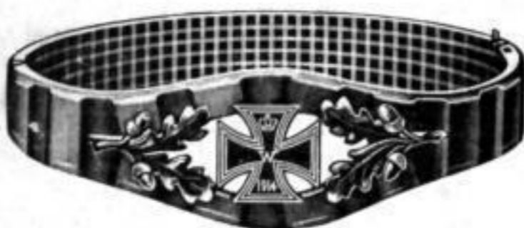
Nr. 550. Stück Mk. D,ls