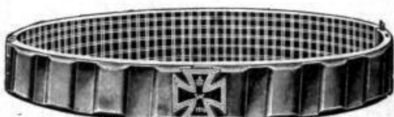
Nr. 525. Stück Mk. A,nu