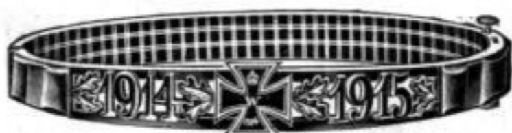
Nr. 534. Stück Mk L,os