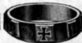
Nr. 93 Dtzd. Mk. U,us