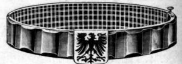
Nr. 532. Stück Mk. L,au