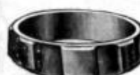
Nr. 91, matt Dtzd. Mk. L,os