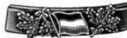
Nr. 721. Stück Mk. B,lu