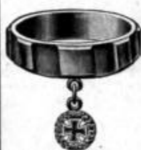
Nr. 97 Dtzd. Mk. U,nu