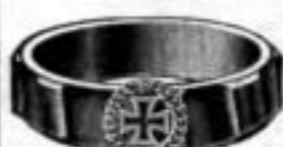
Nr. 95 Dtzd. Mk. U,us