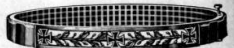
Nr. 544. Stück Mk. L,nu