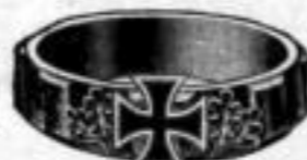
Nr. 94 Dtzd. Mk. I,du