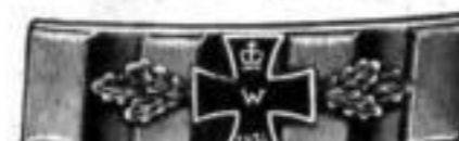
Nr. 722. Stück Mk. B,us