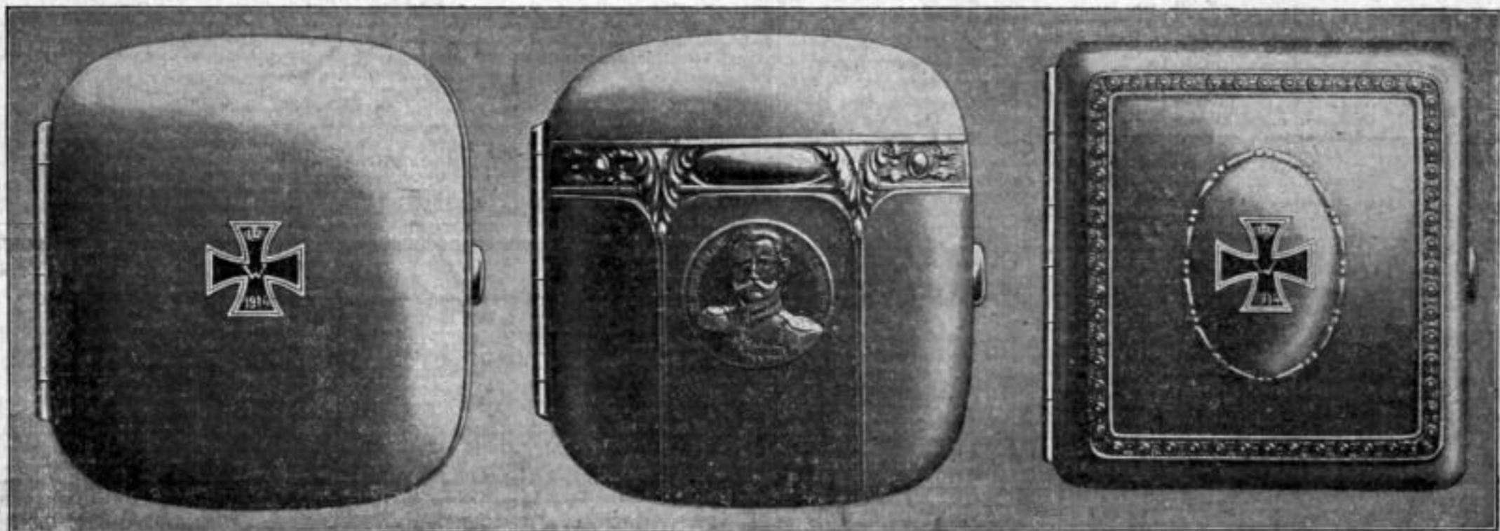
Nr. 73/37. Stück Mk. A,uu.