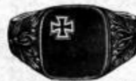
Nr. 56632, matt.