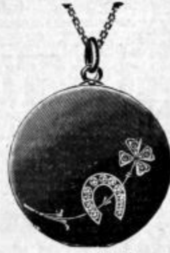
Nr. 5756 1/2.