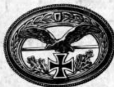
Nr. 735. Amerik. Doublé. Stück Mk. B,os.