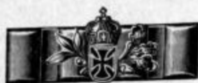
Nr. 737. Feuervergoldet. Stück Mk. B,us.