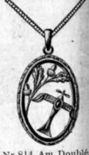
Nr. 814. Am. Doublé. Stück Mk. L,su.