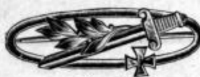
Nr. 936. Alpaka. Dtzd. Mk. BB,rs. Stück Mk. B,—.