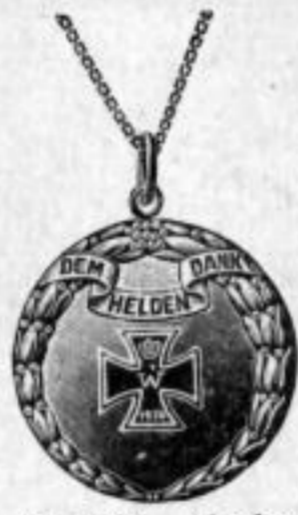
Nr. 1869. Alpaka. Stück Mk. B,su.