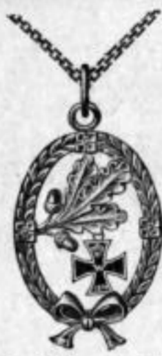
Nr. 1867. Alpaka. Stück Mk. B,ds.