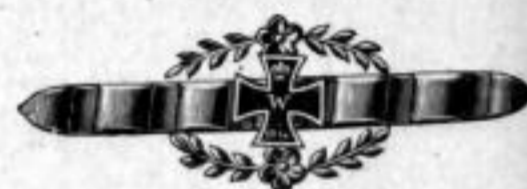
Nr. 732. Feuervergoldet. Stück Mk. B,lu.