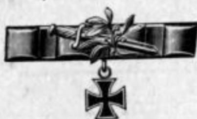
Nr. 738. Feuervergoldet. Stück Mk. B,lu.