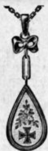
Nr. 3463. Flume. Elektr. plattiert. Stück Mk. A,su.