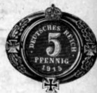
Nr. 736. Amerik. Doublé. Stück Mk. B,us.