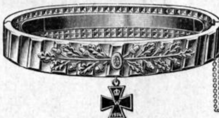
Nr. 552b. Feuervergoldet. Stück Mk. L,lu.