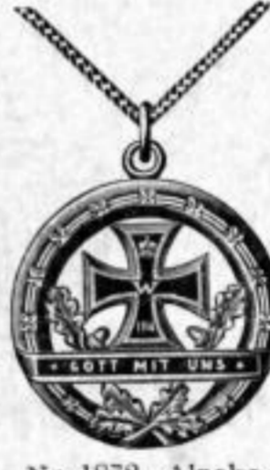
Nr. 1872. Alpaka. Stück Mk. B,bu.