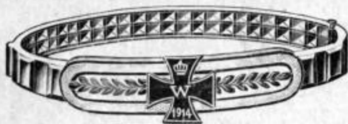
Nr. 552 1 / 2 . Feuervergoldet. Stück Mk. D,—.