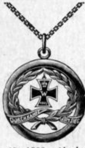
Nr. 1866. Alpaka. Stück Mk. B,ls.