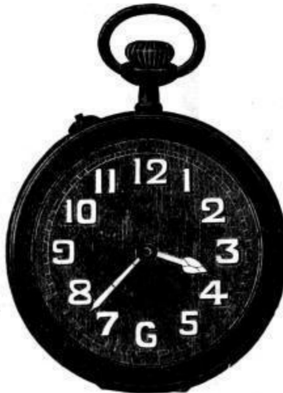
Nr. 40122. Vernickelt, System Roskopf, mit Radiumzahlen. Bei Dutzendabnahme, Stück Mk. Ü,us. Darunter . . . . . " " U,ls.