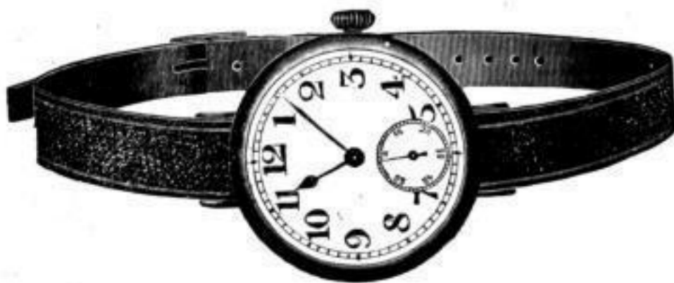
Nr. 40102. Armbanduhr , vernickelt, mit Scharnier. Anker, 10 Rubis . . . . . Stück Mk. BB,—. Nr. 40103. Desgl. Silber 900 / 1000 . . . . . " " BL,—.

„Nachts leuchtend“, mit Radiumpunkten, per Stück Mk. S,lu mehr.