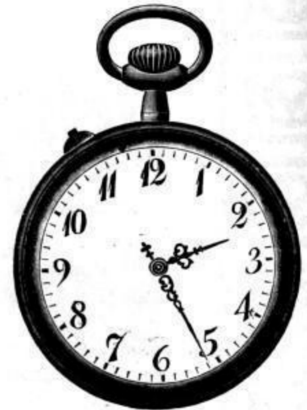
Nr. 40091. Vernickelt, mit Scharnier. System Roskopf. Bei Dutzendabnahme, Stück Mk. L,ou. Darunter . . . . . " " D,bs. „Nachts leuchtend“, p. Stück Mk. S,os mehr.