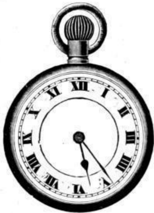
Nr. 40089. Vernickelt, System Roskopf. Bei Dutzendabnahme, Stück Mk. L,us. Darunter . . . . . " " L,ls. „Nachts leuchtend“, p. Stück Mk. S,os mehr.

Giltig, soweit Vorrat reicht, bis Ende Mai mit 3% Kassa-Skonto.