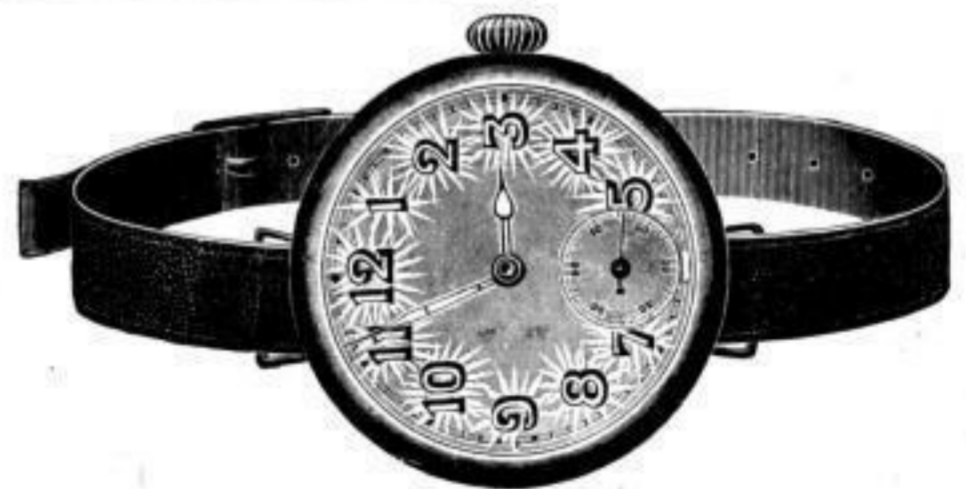
Nr. 40099. Armbanduhr , vernickelt, mit Scharnier. Anker, 7 Rubis, ohne Radium . . . . . Stück Mk. N,lu. Nr. 40100. Desgl. mit Radiumzahlen . . . . . " " BB,us.

Meine Firma hat bereits längst die Beziehungen zu den Munitionsfabriken abgebrochen.