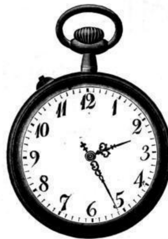
Nr. 40091. Vernickelt, mit Scharnier. System Roskopf. Bei Dutzendabnahme, Stück Mk. L,ou. Darunter . . . . . " " D,bs. „Nachts leuchtend“, p. Stück Mk. S,os mehr.