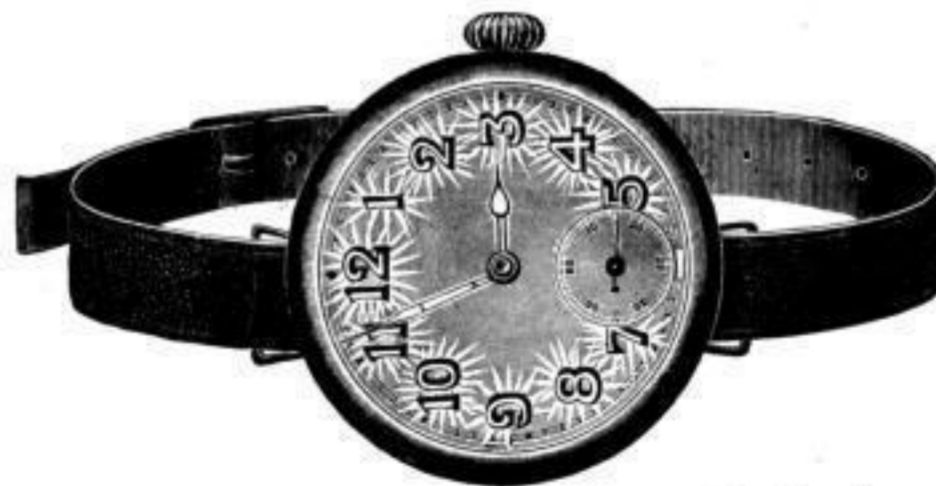
Nr. 40099. Armbanduhr , vernickelt, mit Scharnier. Anker, 7 Rubis, ohne Radium . . . . . Stück Mk. N,lu. Nr. 40100. Desgl. mit Radiumzahlen . . . . . " " BB,us.

Meine Firma hat längst die Beziehungen zu den Munitionsfabriken abgebrochen.