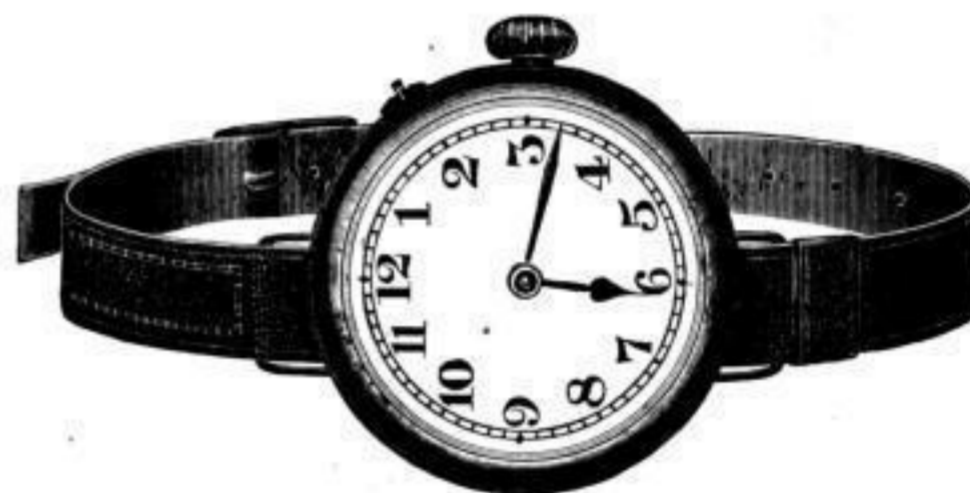
Nr. 40096. Armbanduhr , vernickelt, System Roskopf. Bei Dutzendabnahme . . . . . Stück Mk. U,rs. Bei geringerer Abnahme . . . . . " " U,ns.

„Nachts leuchtend“ , mit Radiumpunkten, per Stück Mk. S,lu mehr.