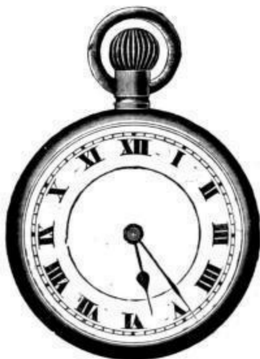
Nr. 40089. Vernickelt, System Roskopf. Bei Dutzendabnahme, Stück Mk. L,us. Darunter . . . . . " " L,ls. „Nachts leuchtend“, p. Stück Mk. S,os mehr.