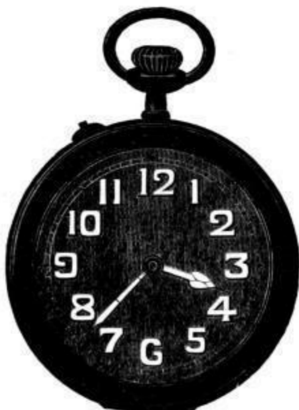
Nr. 40122. Vernickelt, System Roskopf, mit Radiumzahlen. Bei Dutzendabnahme, Stück Mk. U,us. Darunter . . . . . " " U,ls.