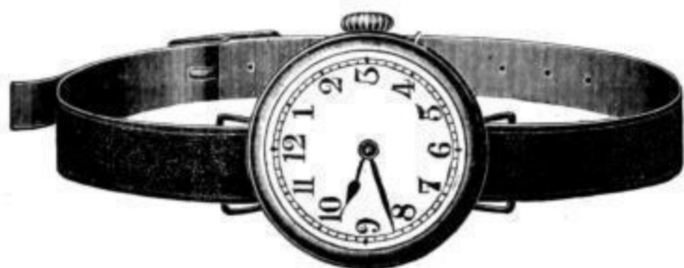
Nr. 40094. Armbanduhr , vernickelt, Zylinderwerk. Bei Dutzendabnahme . . . . . Stück Mk. U,us. Bei geringerer Abnahme . . . . . " " U,ls. Nr. 40101. Desgl. mit Radiumzahlen . . . . . " " N,as.