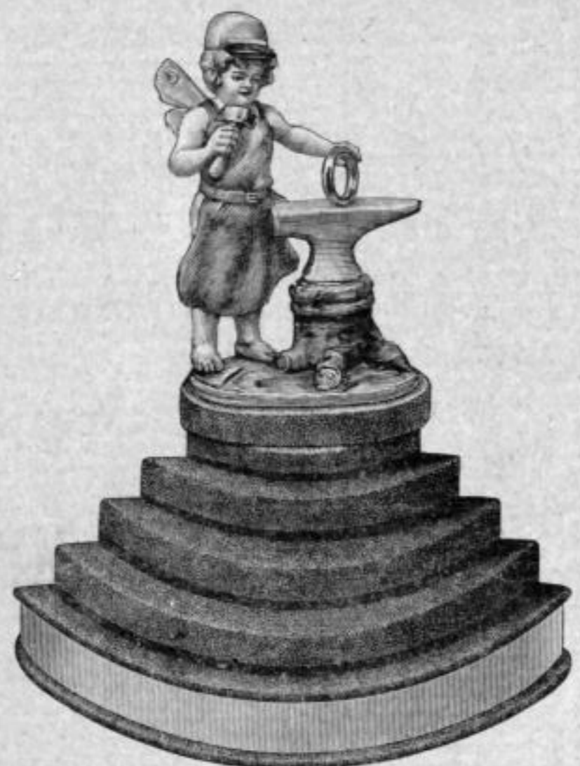
Nr. 9285. Trauringständer,

mit farbiger Porzellanfigur. Höhe 18 \frac{1}{2} cm, Breite 16 cm.