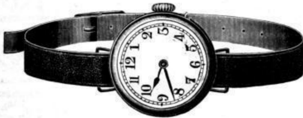
Nr. 40094. Armbanduhr , vernickelt, Zylinderwerk. Bei Dutzendabnahme . . . . . Stück Mk. U,us. Bei geringerer Abnahme . . . . . „ „ U,ls.