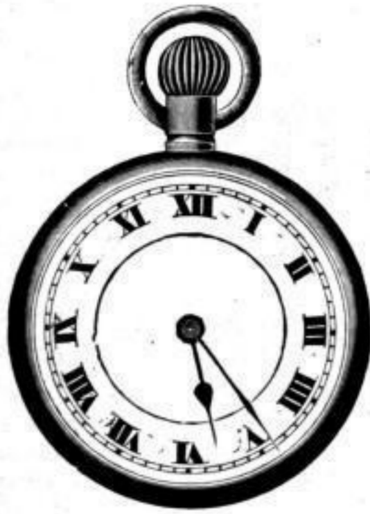
Nr. 40089. Vernickelt, System Roskopf. Bei Dutzendabnahme, Stück Mk. L,us. Darunter „Nachts leuchtend“, p. Stück Mk. S,os mehr.