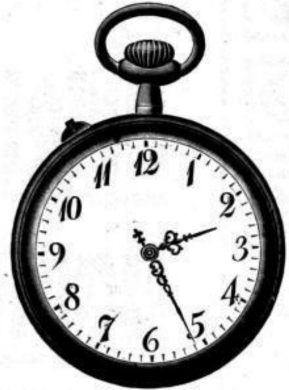
Nr. 40091. Vernickelt, mit Scharnier. System Roskopf. Bei Dutzendabnahme, Stück Mk. L,ou. Darunter „Nachts leuchtend“, p. Stück Mk. S,os mehr.