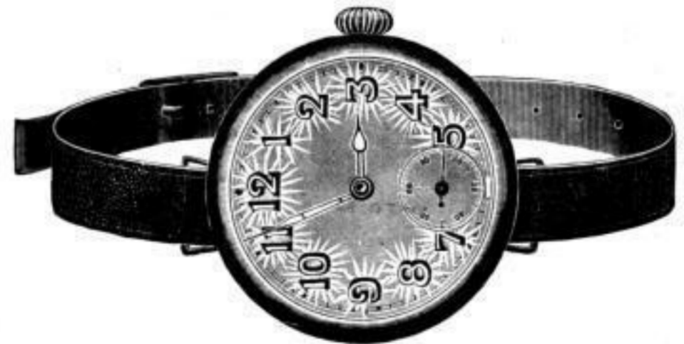
Nr. 40099. Armbanduhr , vernickelt, mit Scharnier. Anker, 7 Rubis, ohne Radium . . . . . Stück Mk. N,lu. Nr. 40100. Desgl. mit Radiumzahlen . . . . . „ „ BB,us.

Meine Firma hat längst die Beziehungen zu den Munitionsfabriken abgebrochen.