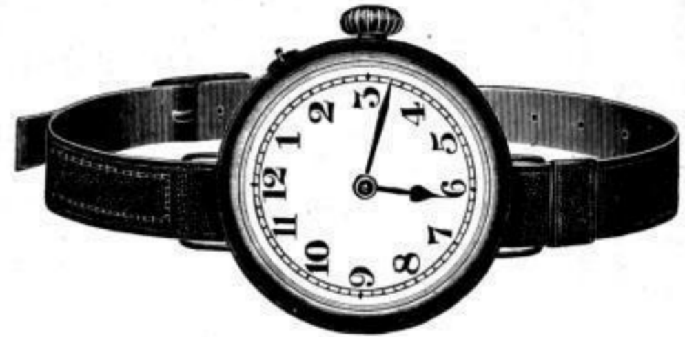
Nr. 40096. Armbanduhr , vernickelt, System Roskopf. Bei Dutzendabnahme . . . . . Stück Mk. U,rs. Bei geringerer Abnahme . . . . . „ „ U,us.

„Nachts leuchtend“ , mit Radiumpunkten, per Stück Mk. S,lu mehr.