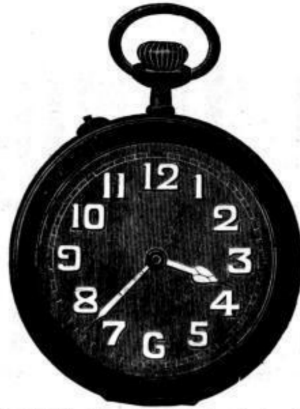
Nr. 40122. Vernickelt, System Roskopf, mit Radiumzahlen. Bei Dutzendabnahme, Stück Mk. U,us. Darunter „ „ „ U,ls.