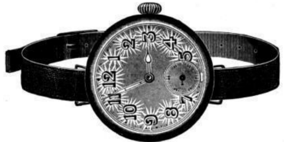
Nr. 40099. Armbanduhr , vernickelt, mit Scharnier. Anker, 7 Rubis, ohne Radium . . . . . Stück Mk. O,ss. Nr. 40100. Desgl. mit Radiumzahlen . . . . . „ BB,lu.

Meine Firma hat längst die Beziehungen zu den Munitionsfabriken abgebrochen.