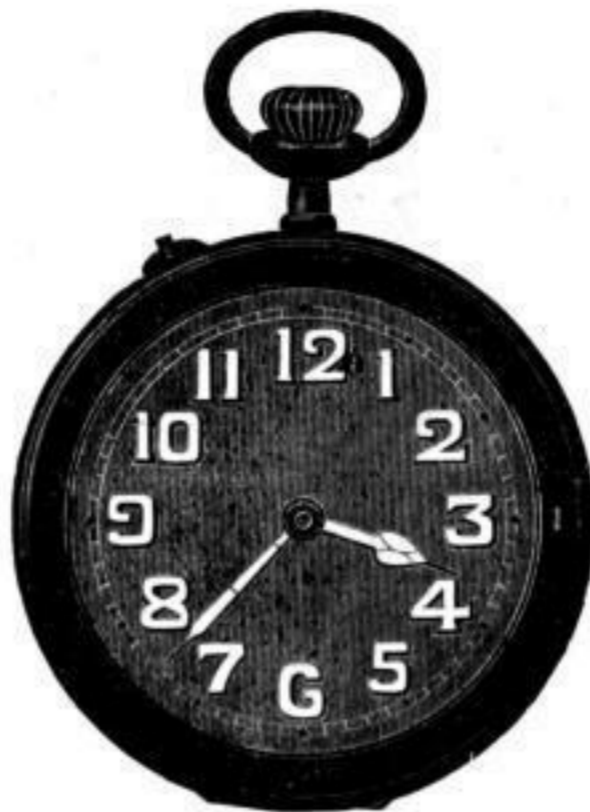
Nr. 40122. Vernickelt, System Roskopf, mit Radiumzahlen. Bei Dutzendabnahme, Stück Mk. U,us. Darunter . . . . . „ U, is.