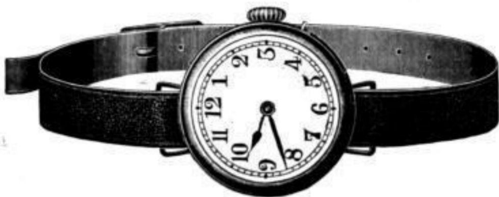
Nr. 40094. Armbanduhr , vernickelt, Zylinderwerk. Bei Dutzendabnahme . . . . . Stück Mk. U, is. Bei geringerer Abnahme . . . . . „ U, os. Nr. 40101. Desgl. mit Radiumzahlen . . . . . „ N, as.