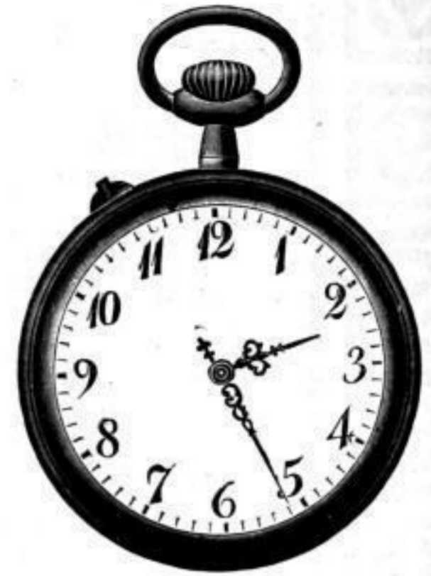
Nr. 40091. Vernickelt, mit Scharnier. System Roskopf. Bei Dutzendabnahme, Stück Mk. L,ou. Darunter . . . . . D,bs. „Nachts leuchtend“, p. Stück Mk. S,os mehr.