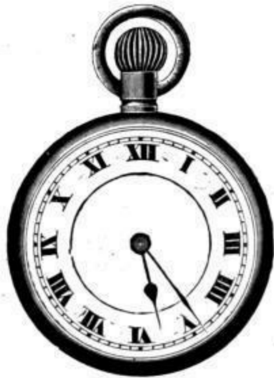
Nr. 40089. Vernickelt, System Roskopf. Bei Dutzendabnahme, Stück Mk. L,us. Darunter . . . . . L, is. „Nachts leuchtend“, p. Stück Mk. S,os mehr.