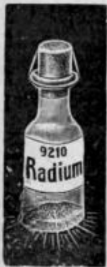
Nr. 9210. Für ca. 10 Uhren. Mk. U,us.

Machen Sie jede Uhr nachtleuchtend mit unserer seit Jahren bewährten Radiummasse . 10 jährige Garantie für Leuchtdauer!