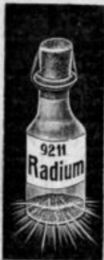
Nr. 9211. Für ca. 20 Uhren. Mk. BS,—.