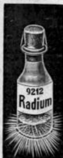
Nr. 9212. Für ca. 45 Uhren. Mk. AS,—.