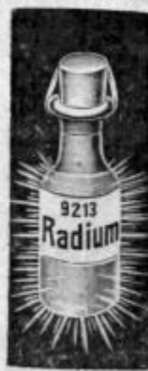
Nr. 9213. Für ca. 120 Uhren. Mk. US,—.

Jede Zusammenstellung enthält: 1 Fläschchen Radiummasse, 1 Fläschchen Lösungsmittel, 1 Fläschchen Speziallack, 1 Porzellan-Näpfchen, 1 Glasstäbchen und solides Aufbewahrungskästchen zu jedem Fläschchen der obenstehenden Radiummasse kostenlos. Wenn die Radium-Leuchtmasse ohne Zubehör gewünscht ist, werden Mk. —,us weniger berechnet.