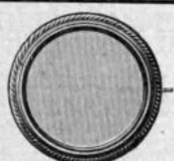
Nr. 137/13. St. Mk. —,nu.