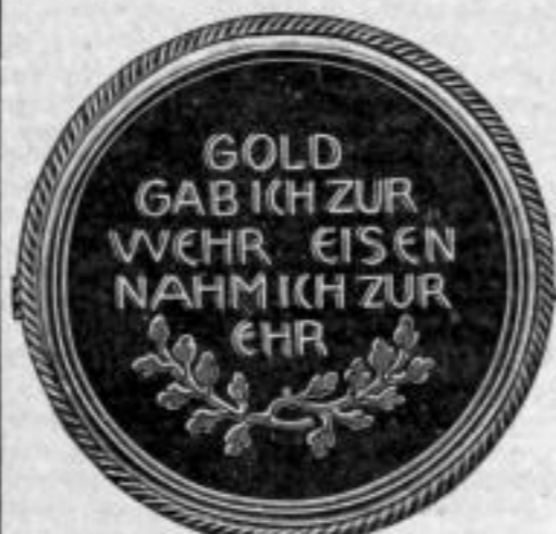
Nr. 137/53. Als Brosche. Silber 800/000. Stück Mk. A,bu. Nr. 137/54. Als Anhänger. Stück Mk. B,au.