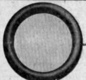
Nr. 133/20. St. Mk. B,au.