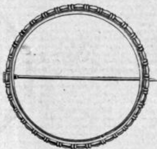
Nr. 137/58. Als Brosche. Silber 800/000. Stück Mk. A,us. Nr. 137/59. Als Anhänger. Stück Mk. A,us.