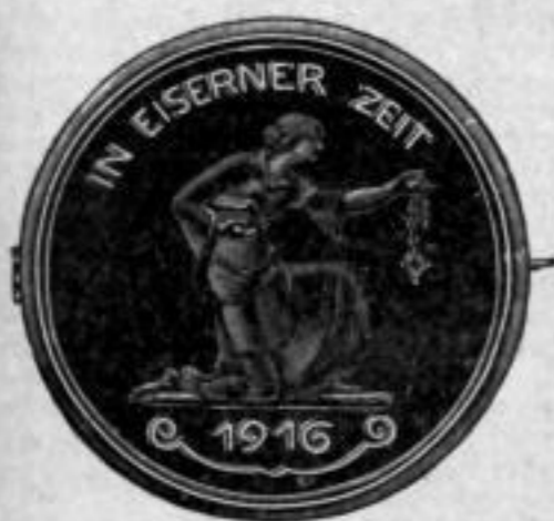
Nr. 137/52. Als Brosche. Silber 800/000. Stück Mk. B,du. Nr. 137/55. Als Anhänger. Stück Mk. B,du.