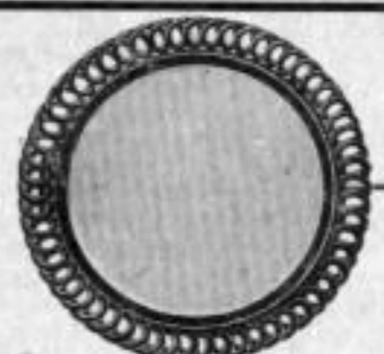
Nr. 133/19. St. Mk. B,au.

Der Versand unserer Weihnachtsliste erfolgt an jeden Fachmann auf Wunsch umsonst und portofrei.