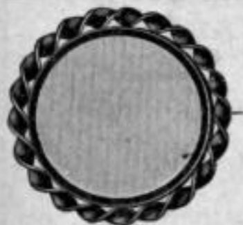
Nr. 133/21. St. Mk. B,au.