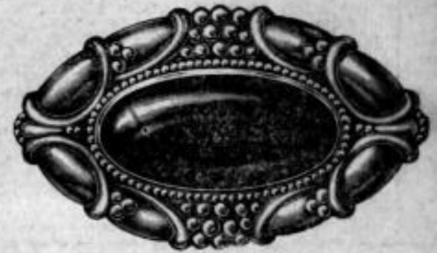
Nr. 1610. Mit braunrotem Stein. Stück Mk. J,su.