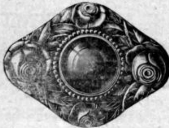
Nr. 1612. Mit grünem Stein. Stück Mk. R,du.