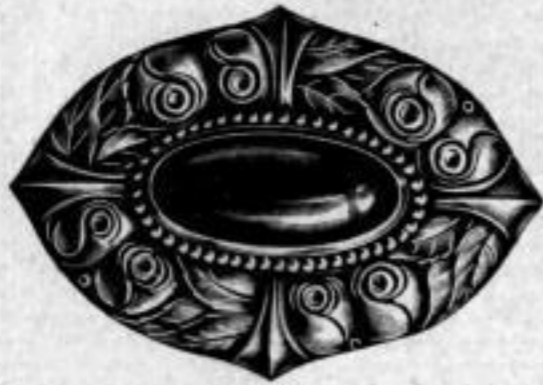
Nr. 1611. Mit grünem Stein. Stück Mk. U,Iu.