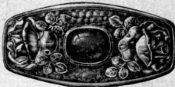
Nr. 1607. Mit braunrotem, grünem oder blauem Stein. Stück Mk. U,bu.