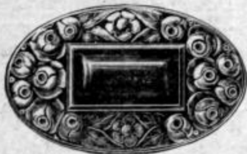
Nr. 1609. Mit braunrotem Stein. Stück Mk. U,Iu.