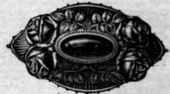
Nr. 1606. Mit braunrotem, grünem oder blauem Stein. Stück Mk. U,bs.