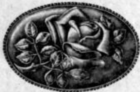
Nr. 1603. Stück Mk. L,—.