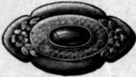
Nr. 1608. Mit rotem, grünem, blauem oder lila Stein. Stück Mk. B,ou.