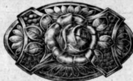
Nr. 1604. Stück Mk. D,uu.