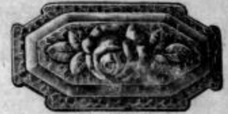
Nr. 1601. Stück Mk. B,ls.