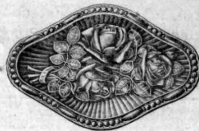
Nr. 1605. Stück Mk. D,ns.