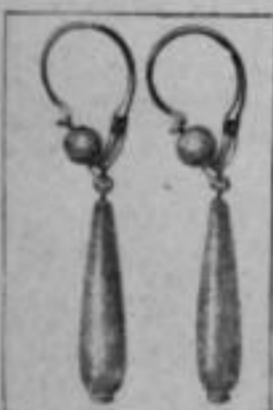
Nr. 175/227 585/000 Paar: Mk. BJ,os