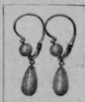
Nr. 175/280 585/000 Mk. BA,—