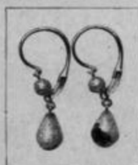
Nr. 175/282 585/000 Mk. N,us