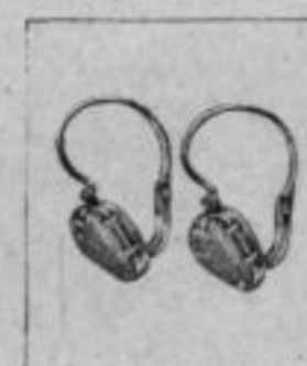
Nr. 175/231 585/000 Mk. AS,us

☞ Sämtliche Ohringe sind Originalgröße. ☜