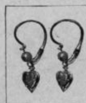
Nr. 175/240 585/000 Mk. AS,Iu