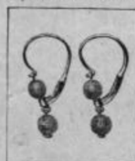
Nr. 175/288 585/000 Mk. J,ns