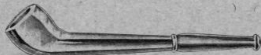
Nr. 211/15. Silber 800, Stück Mk. AL,ru