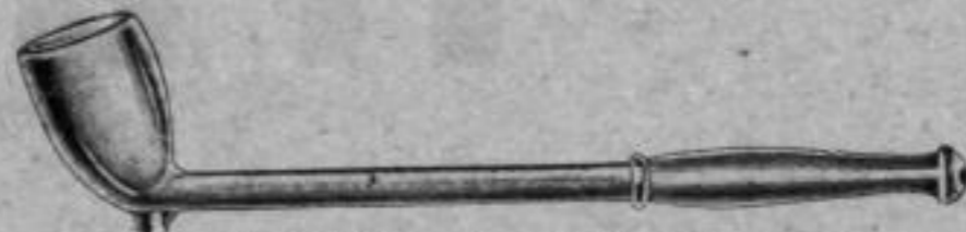
Nr. 211/42. Silber 800, Stück Mk. AL,ru