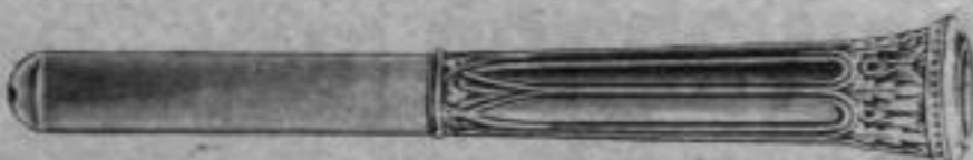
Nr. 237/21. Alpaka, Stück Mk. BA,bu