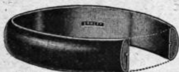
Allseitig Gold, massiver Kern

(Nr. 2259) zur Bestimmung des Gewichts gefasster Brillanten, dreiteilig, aus Neusilber, mit neuester metrischer Einteilung von 1/100 bis 4 Karat, Stück Mk. LJ,us.