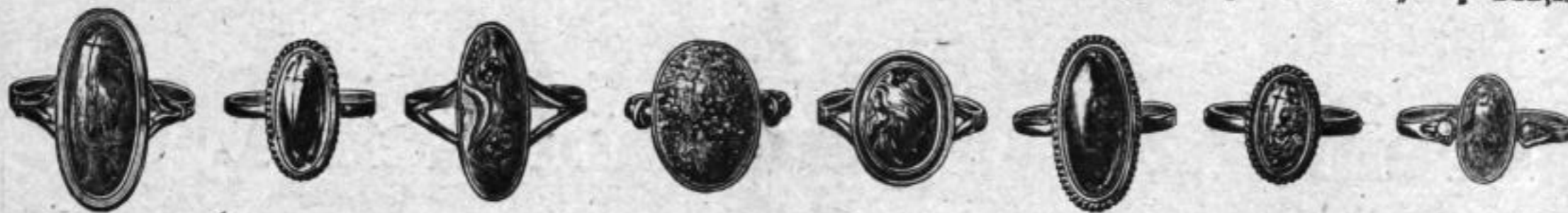
Nr. 1766 Nr. 1764 Nr. 1771 Nr. 1768 Nr. 1767 Nr. 1716 Nr. 1770 Nr. 1769