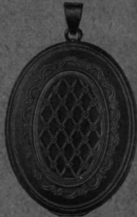
Nr. 62 Mk. AR,lu