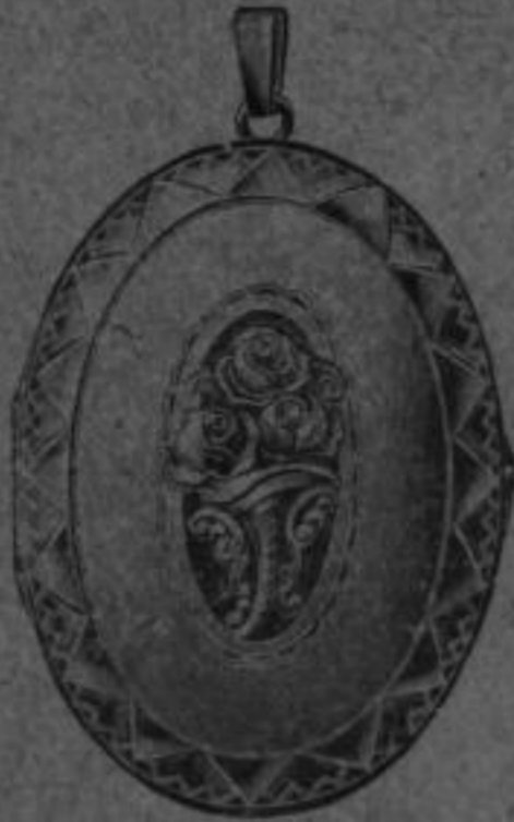
Nr. 522 Mk. LB,bs