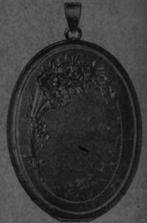
Nr. 66 Mk. AA,su