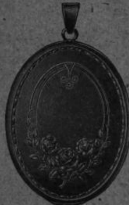
Nr. 61 Mk. AR,lu