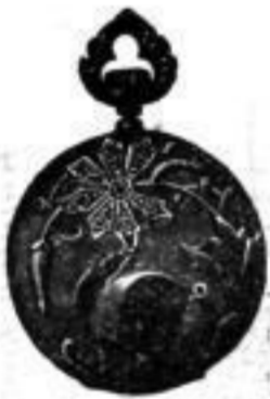
Damen-Uhren in grosser Auswahl