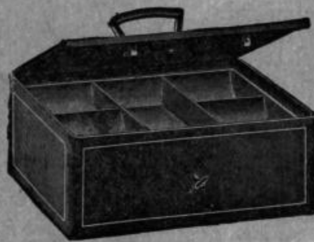
Nr. 5542 Eiserne Kassette