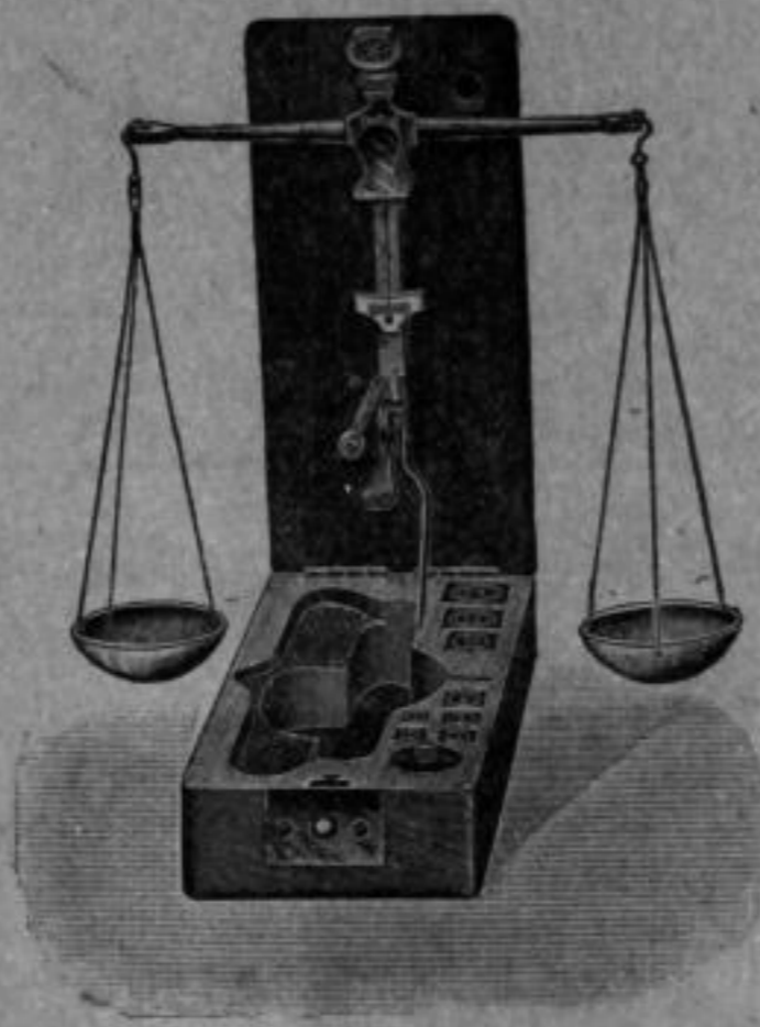
Nr. 4319 Diamantwage