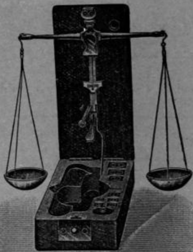
Nr. 4319 Diamantwage