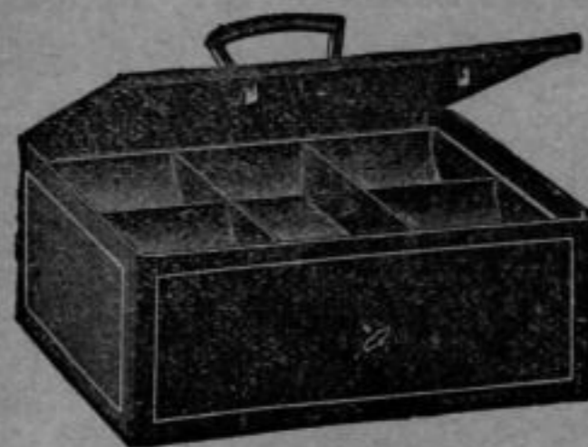
Nr. 5542 Eiserne Kassette