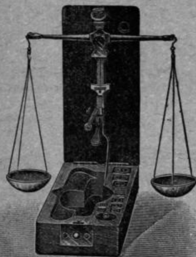
Nr. 4319 Diamantwage