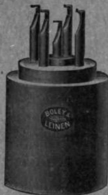
Nr. 5904. Bunzen für Zylinderzapfen