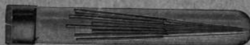
Nr. 2259 B. Zapfenreibahlen