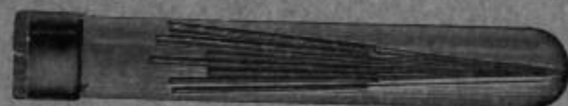
Nr. 2259 B. Zapfenreibahlen