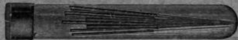
Nr. 2259 B. Zapfenreibahlen