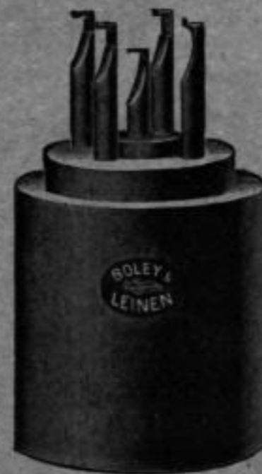
Nr. 5904. Bunzen für Zylinderzapfen