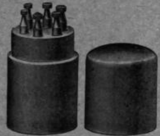
Nr. 6094. Fassungsräser