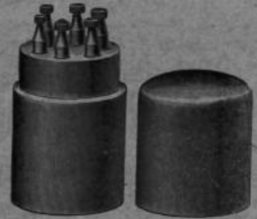
Nr. 6094. Fassungsträger