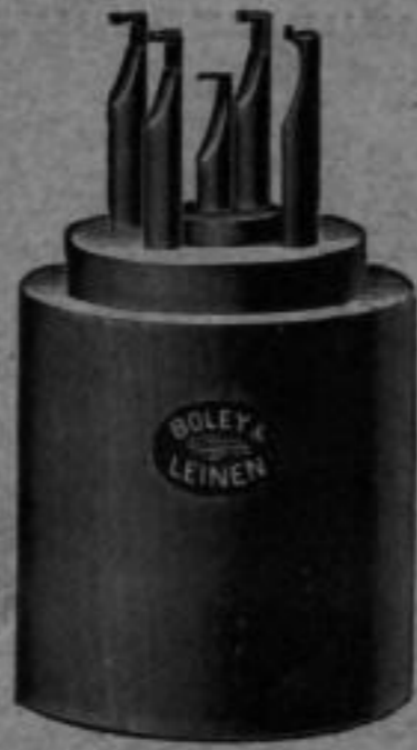
Nr. 5904. Bunzen für Zylinderzapfen