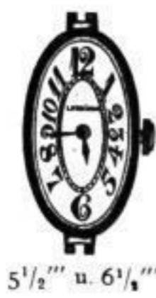
5 1/2" u. 6 1/8"