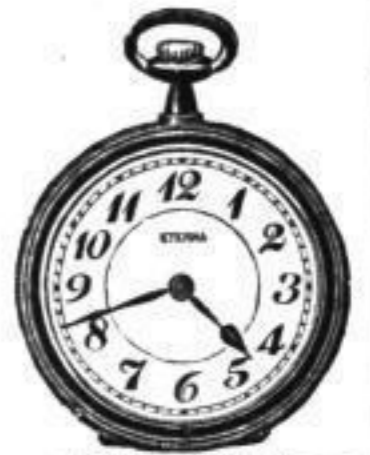
10" bis 20"