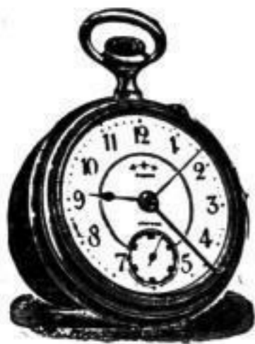
Taschenwecker 13" bis 20"

Anker-Präzisionsuhren stets lagernd in jeder Art