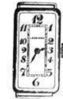
5 1/8" u. 6 1/8"