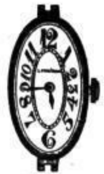
5 1/2''' u. 6 1/4'''