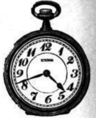
10'' bis 20''

Anker-Präzisionsuhren stets lagernd in jeder Art