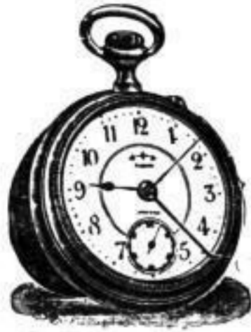
Taschenwecker 13'' bis 20''