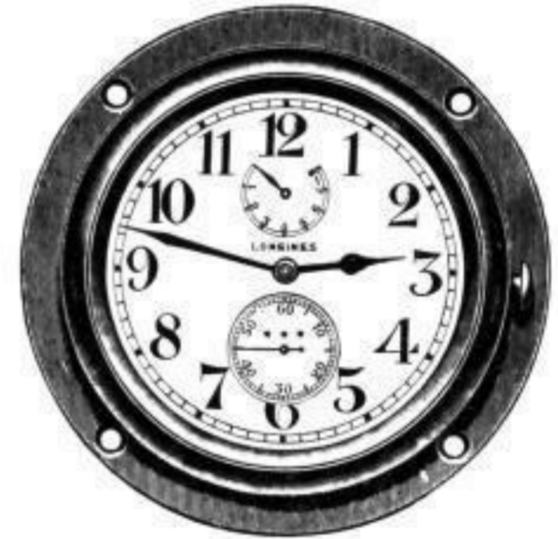
Auto-Uhren mit 8 Tage-Präzisions-Werk