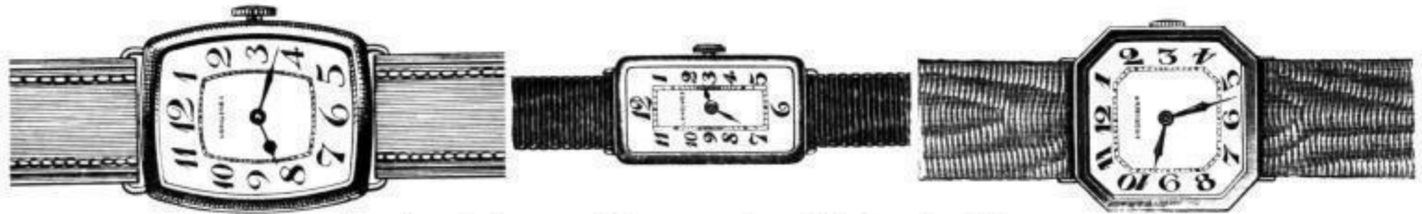
Herren-Armbanduhren. Die neuesten Muster in Silber und Gold