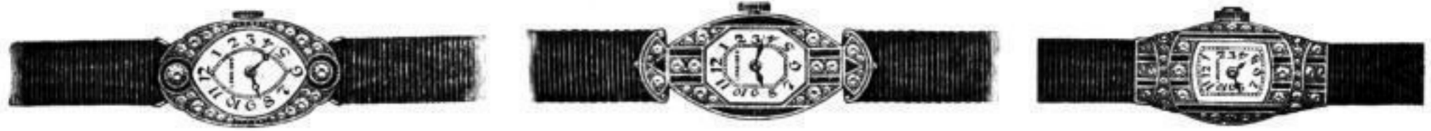
Armbanduhren von 5''' an in Gold und Platina mit Steinen dekoriert

17 erste, 7 große Preise auf Weltausstellungen