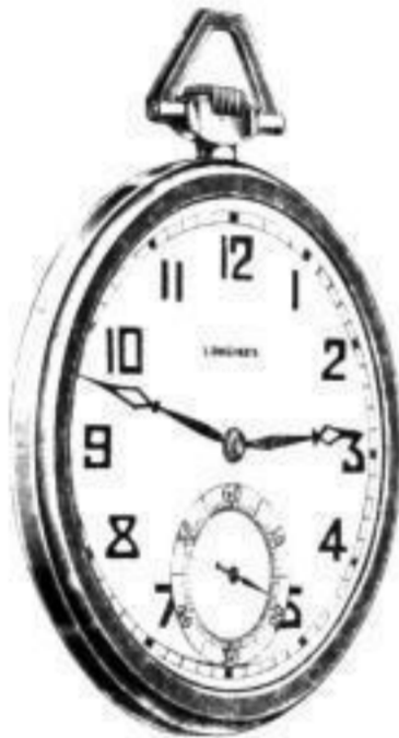
Frackuhren Verschiedene Formen