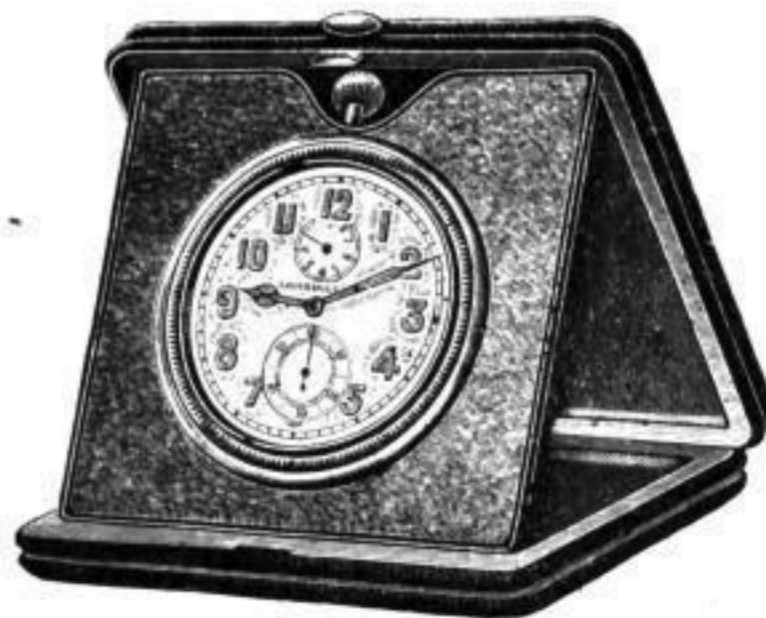
Reiseuhren mit 8 Tage-Werk in verschiedenen Ausführungen