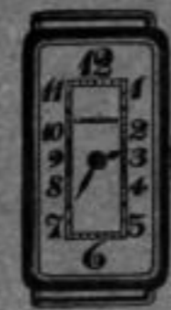
5 1/2''' u. 6 1/2'''

Reiseuhren mit 8-Tagewerk, versch. Ausführ.