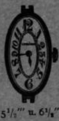
5 1/2''' u. 6 1/2'''