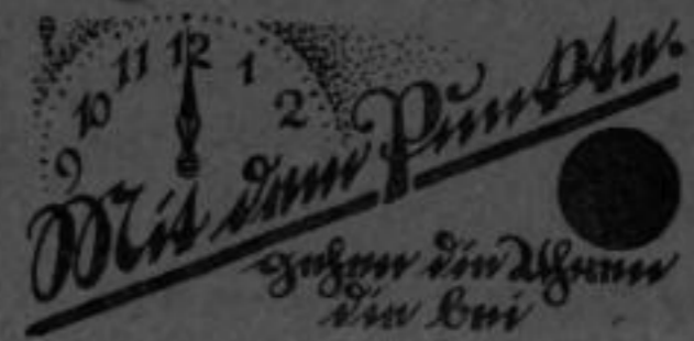
(Raum für die Firma)