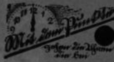
(Raum für die Firma)