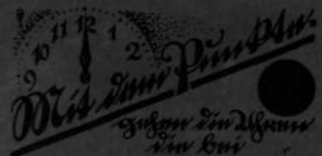
(Raum für die Firma) sugewohnt werden sind! Nr. 26