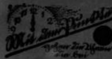
(Raum für die Firma) sugewohnt werden sind! Nr. 24